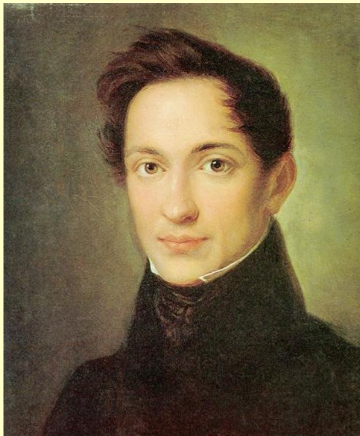
А. И. Герцен