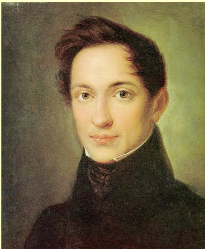
А. И. Герцен