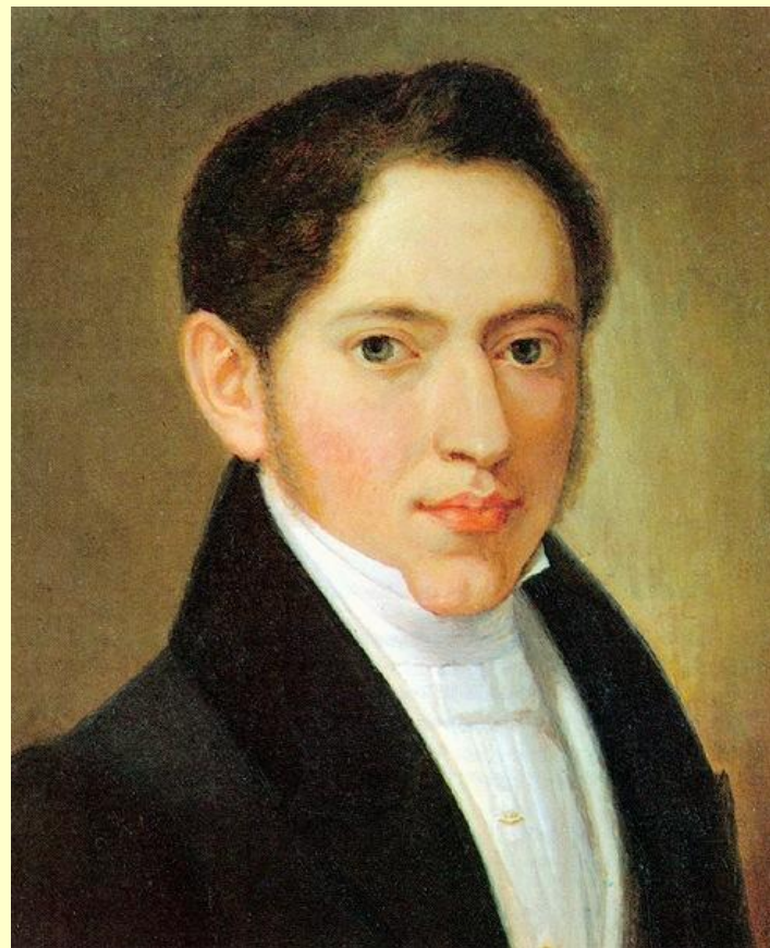
Н. П. Огарёв