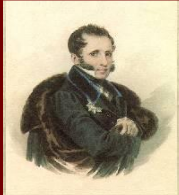
Портрет Уварова С.С.