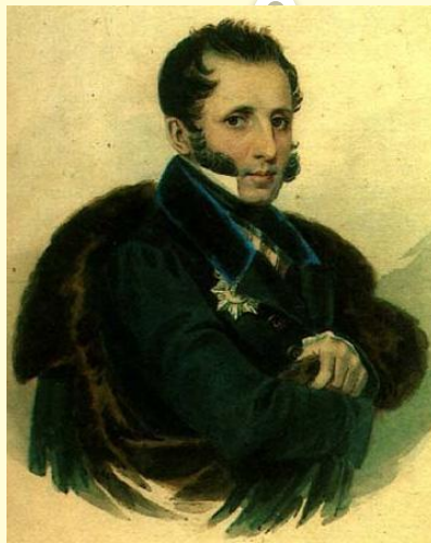
Сергей Семенович Уваров