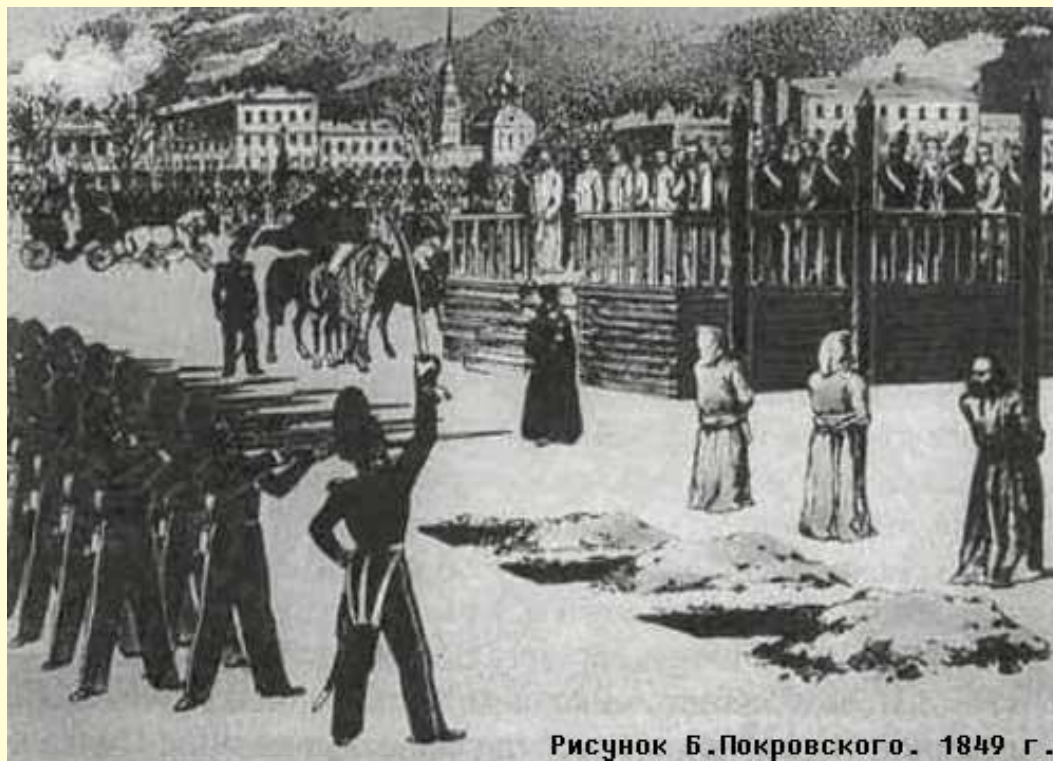
Рисунок Б.Покровского. 1849 г.