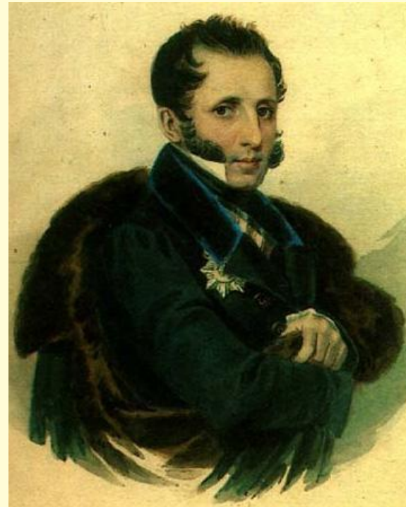
Сергей Семенович Уваров