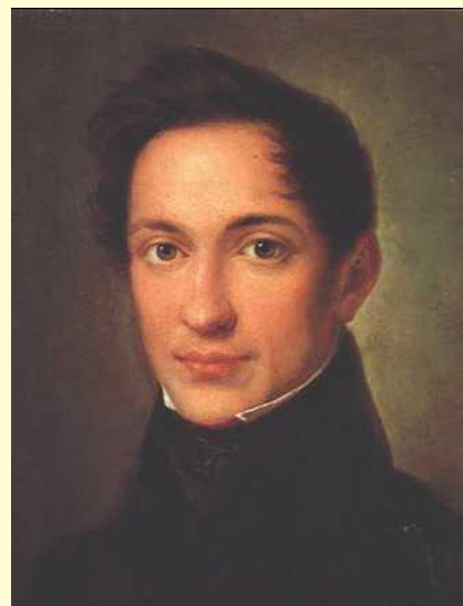
Александр Иванович Герцен