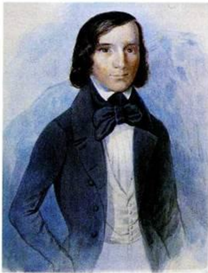
Кружок Н.В. Станкевича