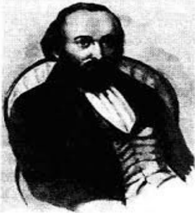
М. В. Буташевич-Петрашевский

Социализм – учение, выдвигающее в качестве цели и идеала установление общества, в котором отсутствует эксплуатация человека человеком и социальное угнетение; утверждаются социальное равенство и справедливость.