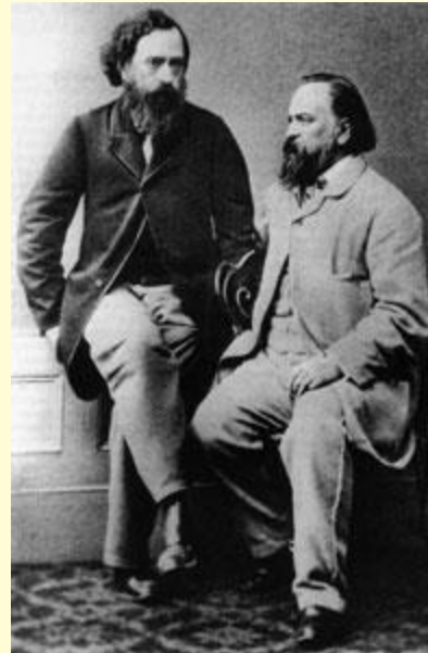
Кружок Герцена и Огарёва