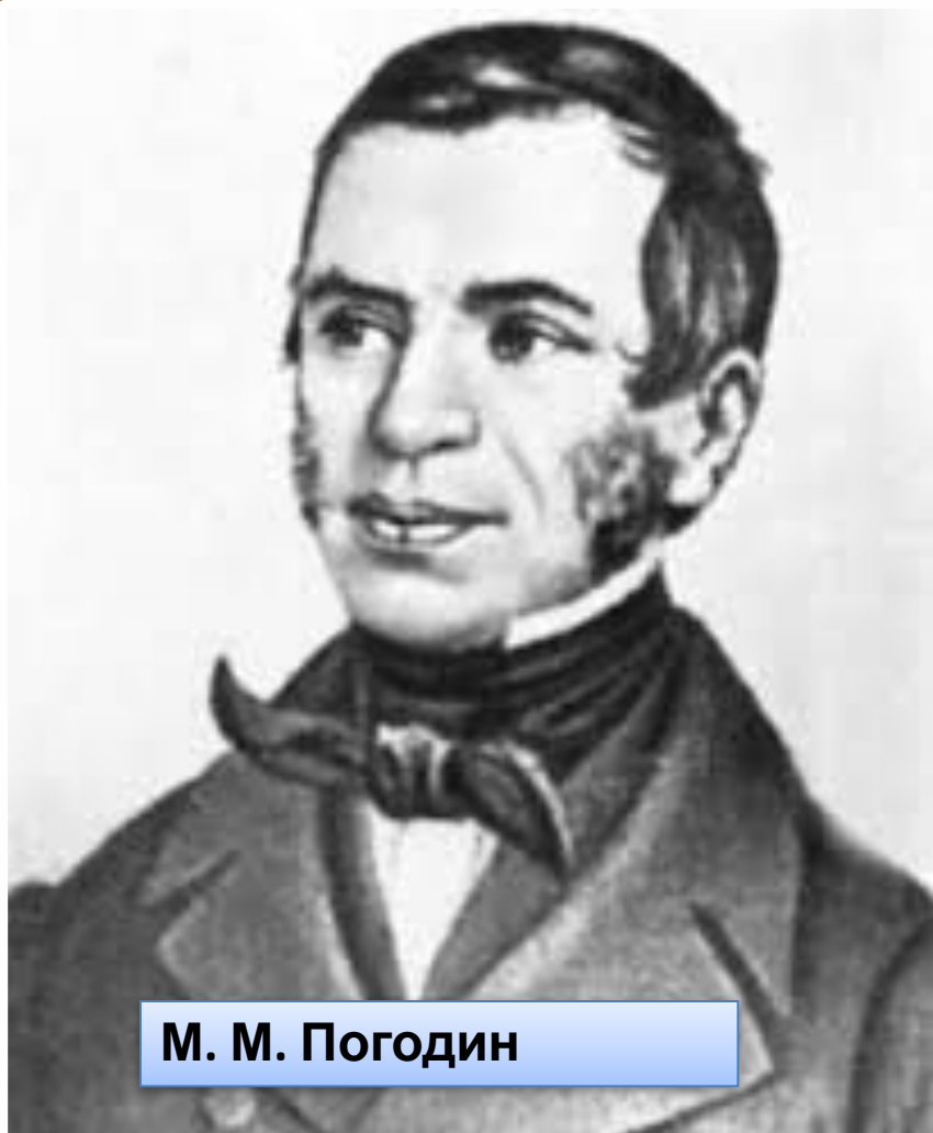
М. М. Погодин