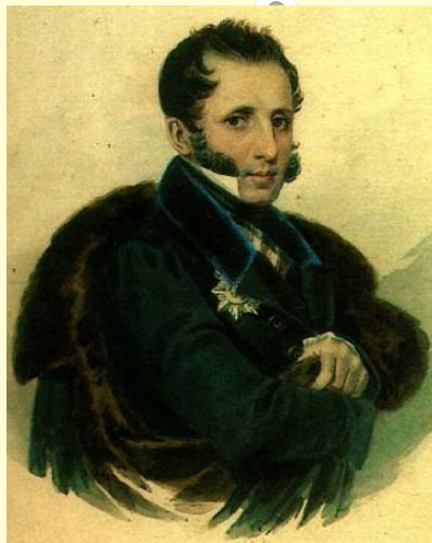
Сергей Семенович Уваров