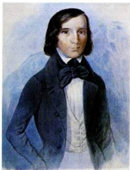
Кружок Н.В. Станкевича