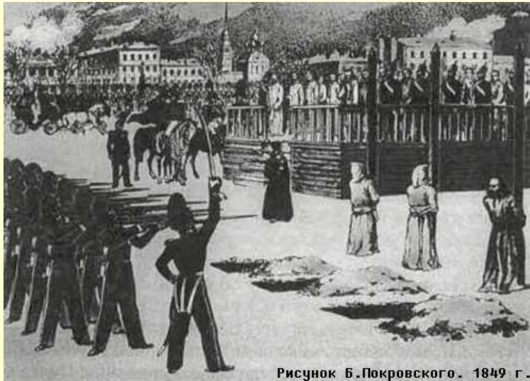
Рисунок Б.Покровского. 1849 г.