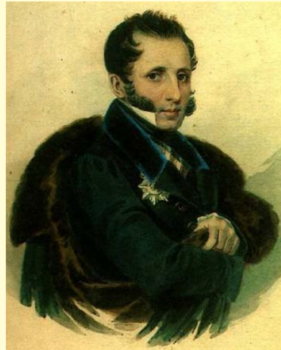
Сергей Семенович Уваров