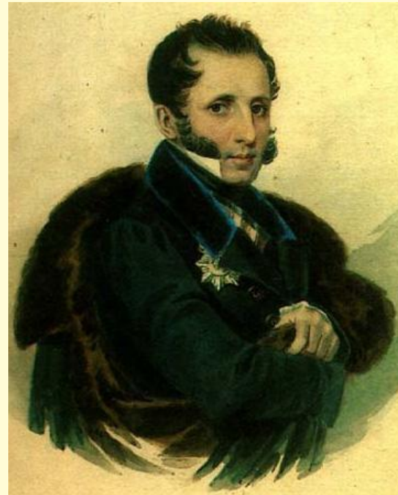
Сергей Семенович Уваров