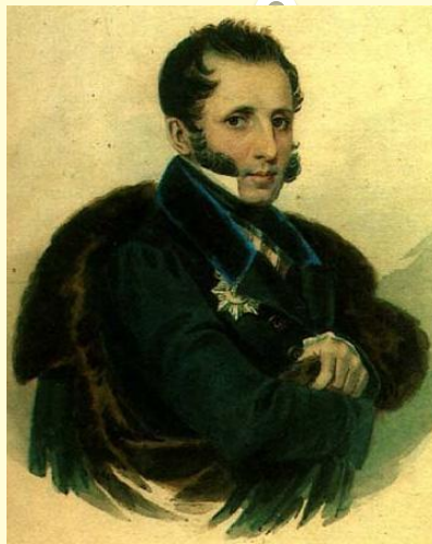
Сергей Семенович Уваров