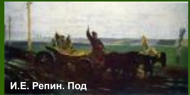
И.Е. Репин. Под