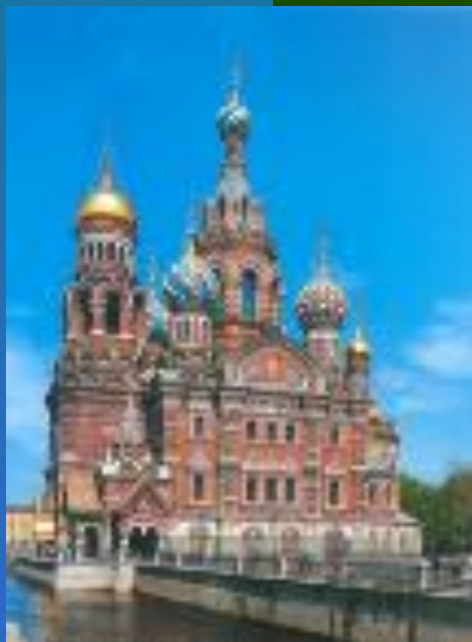
Храм Спаса на крови возведен *на месте убийства Александра II

1 марта 1881 года Александр II направился на развод войск в Михайловский замок. На всем пути возможного следования царской кареты были поставлены бомбометатели. Император был смертельно ранен бомбой, брошенной И. Гриневицким, который также погиб. Через девять часов после взрыва царь скончался.