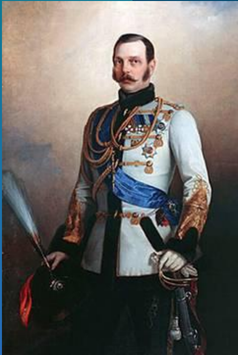
Александр II Освободитель 1818 - 1881 1855 - 1881