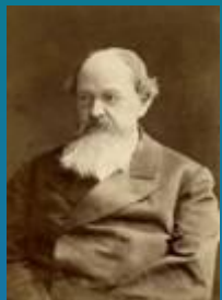
К. Д. Кавелин