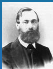
Б. Н. Чичерин