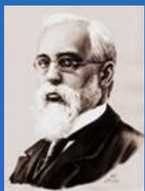
С. А. Муромцев