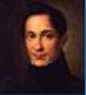
А.И. Герцен 1812-1870

Социализм – учение, выдвигающее в качестве цели и идеала установление общества, в котором отсутствуют эксплуатация человека человеком и социальное угнетение; утверждаются социальное равенство и справедливость