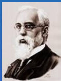
С. А. Муромцев