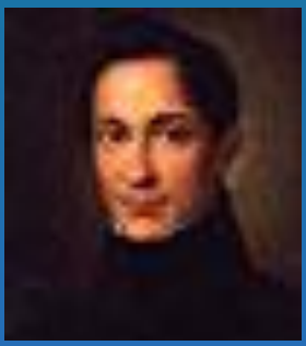
А.И. Герцен 1812-1870

Социализм – учение, выдвигающее в качестве цели и идеала установление общества, в котором отсутствуют эксплуатация человека человеком и социальное угнетение; утверждаются социальное равенство и справедливость