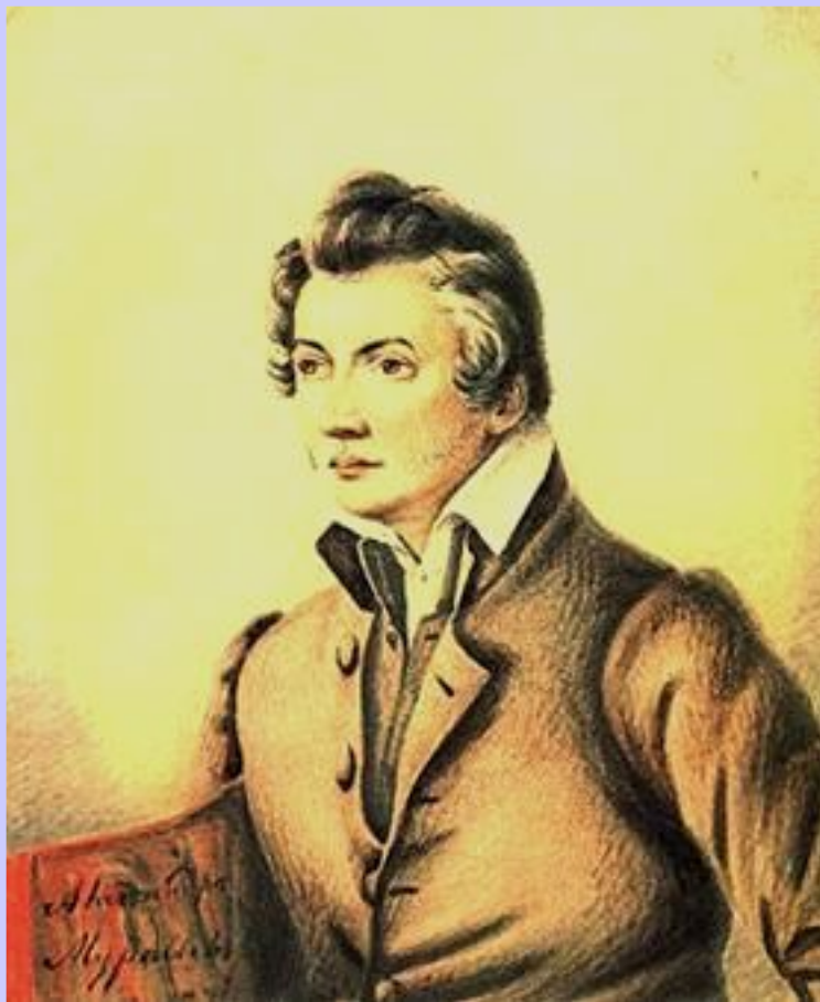
А.Муравьев. Портрет Н.Муравьева.