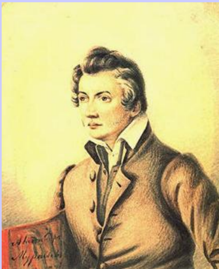
А.Муравьев. Портрет Н.Муравьева.