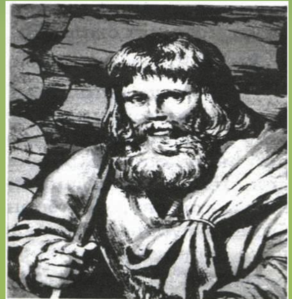
Крестьянин. Его внешний вид и труд не менялись на протяжении веков