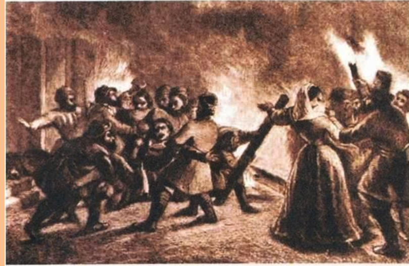
Поджог помещицкой усадьбы. Рисунок XIX в.