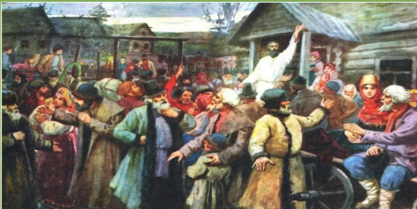
В Бездне. Художник В. Зайцев