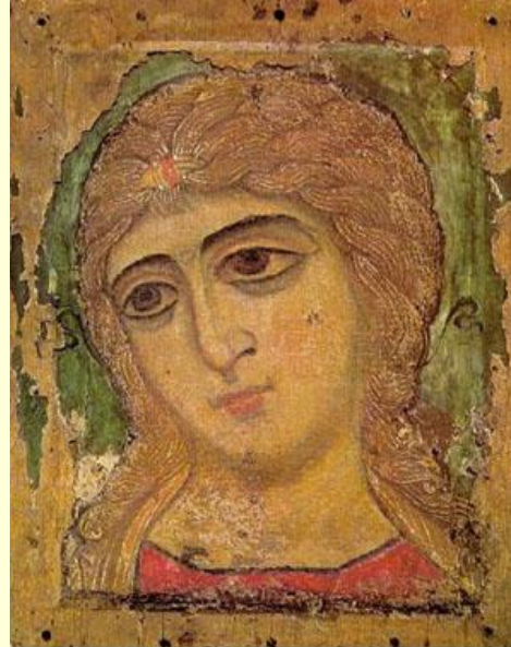
Икона «Ангел Златые власы» XII в.

Именно этот период истории подарил миру такие шедевры искусства как «Повесть временных лет» и «Слово о полку Игореве», «Слово Даниила Заточника», «Поучение» Владимира Мономаха в литературе, Успенский собор во Владимире и церковь Покрова на Нерли в архитектуре, иконы «Владимирская Богоматерь» и «Ангел Златые власы» в иконописи.