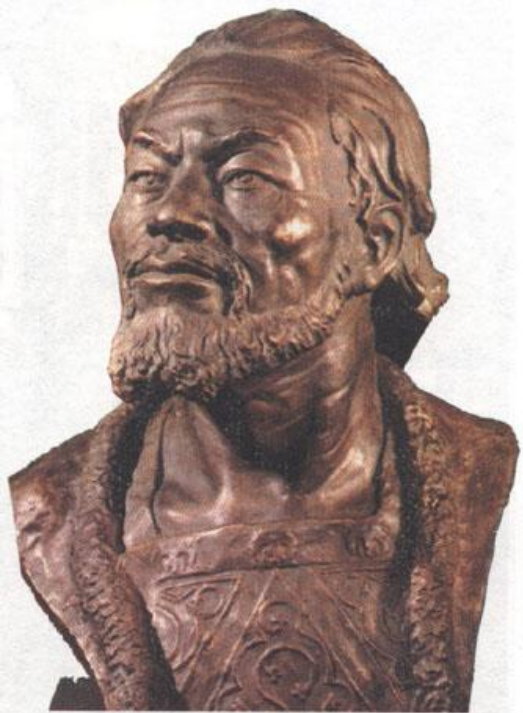
Андрей Боголюбский. Реконструкция М. Герасимова

В то время, когда в Галицко-Волынском княжестве шли бесконечные распри между князьями и боярством, в Новгороде - ссоры и усобицы на вечеах, на Северо-Востоке русских земель закладывались основы новой русской государственности.