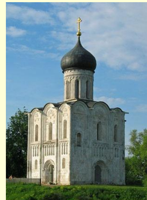
Церковь Покрова на Нерли. 1165.