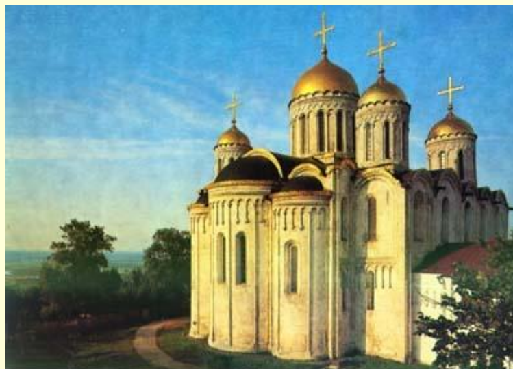
Успенский собор во Владимире. 1158-1161.