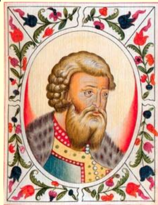
Великий князь владимирский Всеволод III Юрьевич Большое Гнездо

Однако Владимиро-Суздальское княжество повторило судьбу всех русских земель: после смерти Всеволода Большое Гнездо оно распалось на множество мелких.