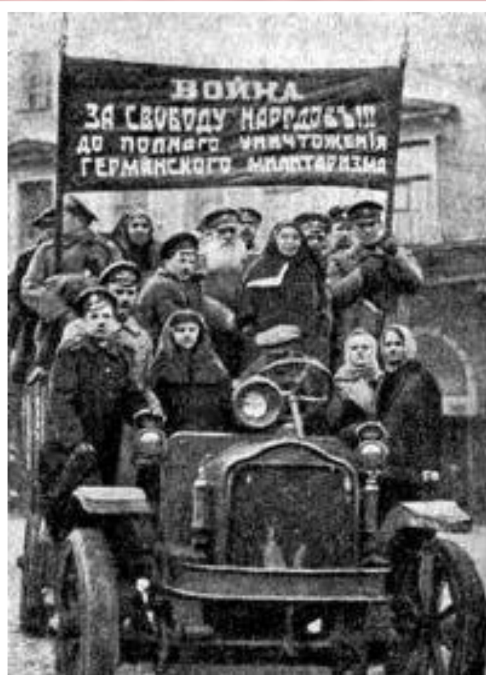
Демонстрация в поддержку войны

Хотя II съезд Советов принял Декрет о мире, в руководстве большевиков единства по этому вопросу не было. Часть руководства стояла на позиции «Мировой революции»-Победа социреволюции в России будет обеспечена лишь тогда, когда революции победят в других странах. Поэтому предполагалось, что западные государства откажутся подписать мир, и Россия сможет начать революционную войну.