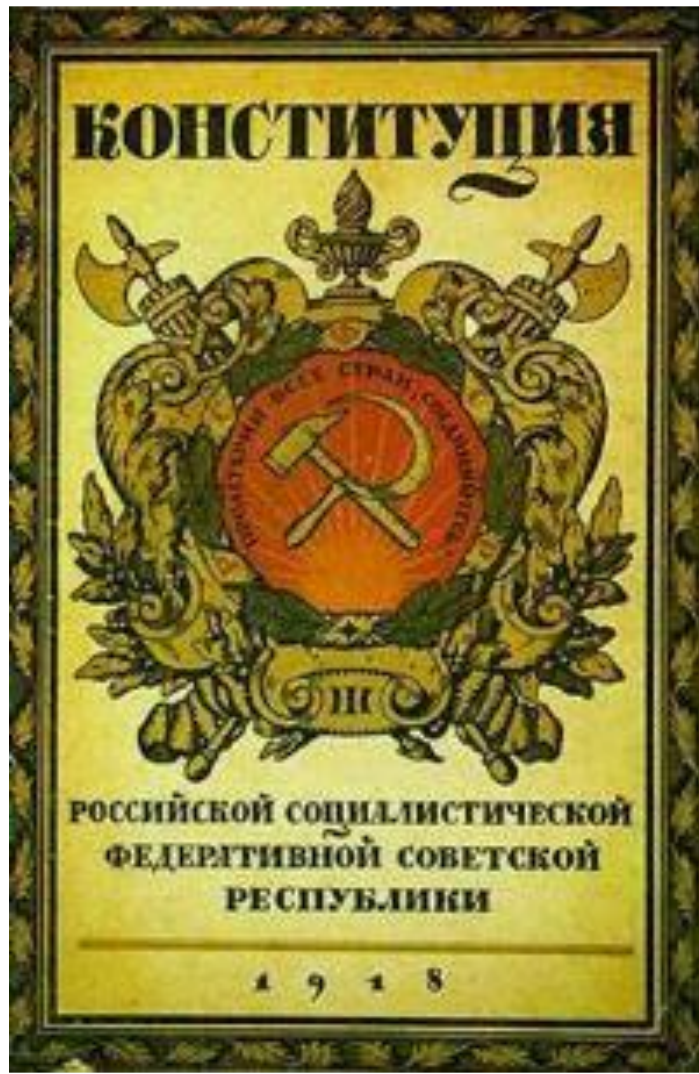
Конституция РСФСР 1918 г.

9 июля 1918 г. V Всероссийский съезд Советов возобновил работу. 10 июля он принял Конституцию РСФСР, которая провозглашала Советскую власть в форме диктатуры пролетариата и беднейшего крестьянства. Высшим органом власти становился Съезд Советов, а в промежутках между Съездами - ВЦИК. Исполнительная власть принадлежала Совнаркому.