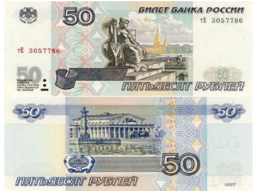
Банкнота номиналом в 50 рублей

На оборотной стороне банкноты: вверху слева и справа расположены числа 50 в узорных розетках и горизонтальные линии микротекста «50», отпечатанные синей краской. В центре - гравюра с изображением здания бывшей биржи и Ростральной колонны в г. Санкт-Петербурге.