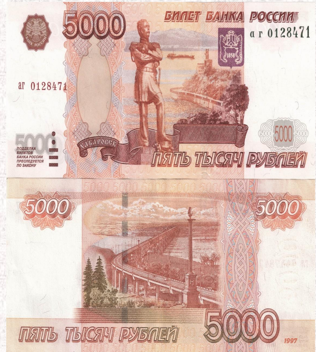
Банкнота достоинством 5000 рублей

Преобладающий цвет банкноты - красно-коричневый. Преобладающий цвет банкноты - красно-коричневый. Банкнота обладает несколькими машиночитаемыми защитными признаками. машиночитаемыми защитными признаками.