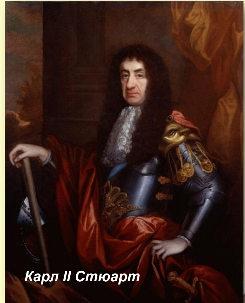
Карл II Стюарт