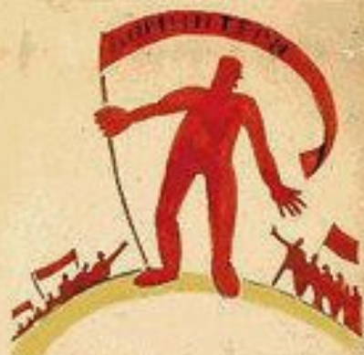
3. СЪВЪРШЕНСТВО НА ПЪРВИЯ ПЕРИОД ПОСЛЕДНО НАСЛЕДСТВО НА ПЪРВИЯ ПЕРИОД