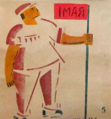
ЕСЛИ ПРАЗДНИК- ТАК ДЛЯ ВСЕГО НАРОДА