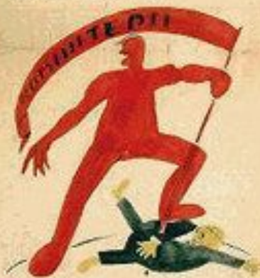
4. ВЪВЕДЕНИЕ НА ПЪРВИЯ ПЕРИОД