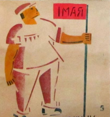
ЕСЛИ ПРАЗДНИК- ТАК ДЛЯ ВСЕГО НАРОДА