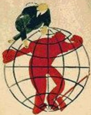
1. ПЕРВ. СТАНОВИШЕ НА БУДУЩАТА