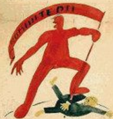
4. И. СЪИДИТЕ ПИИ ПИИИ ПИИИ