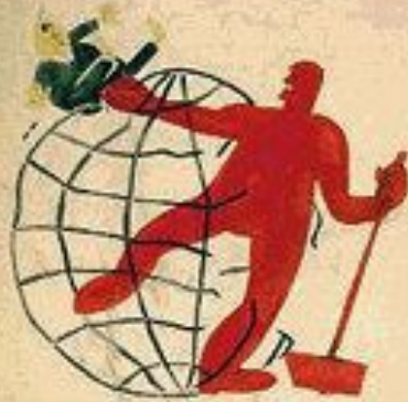
2. ИИИИИ ИИИИИИ ИИИ.