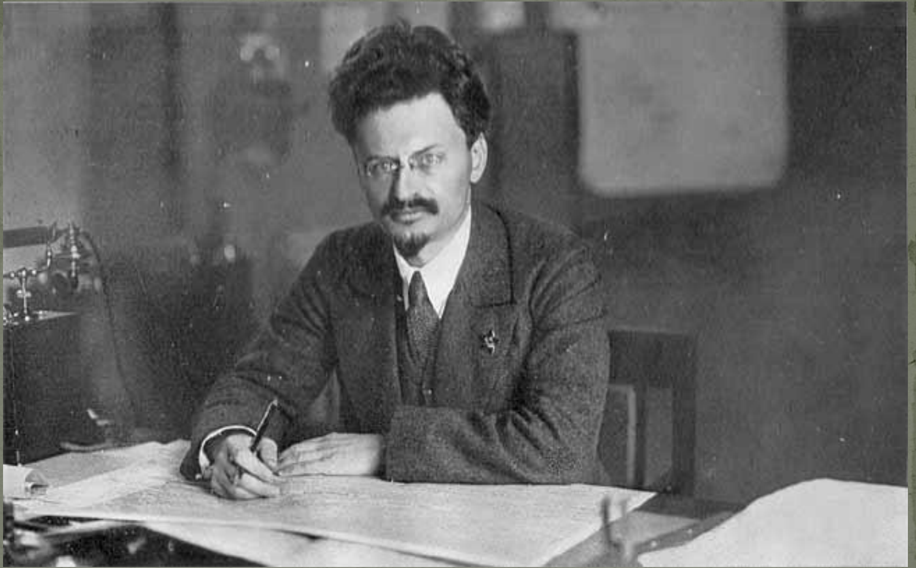
Лев Давидович Троцкий