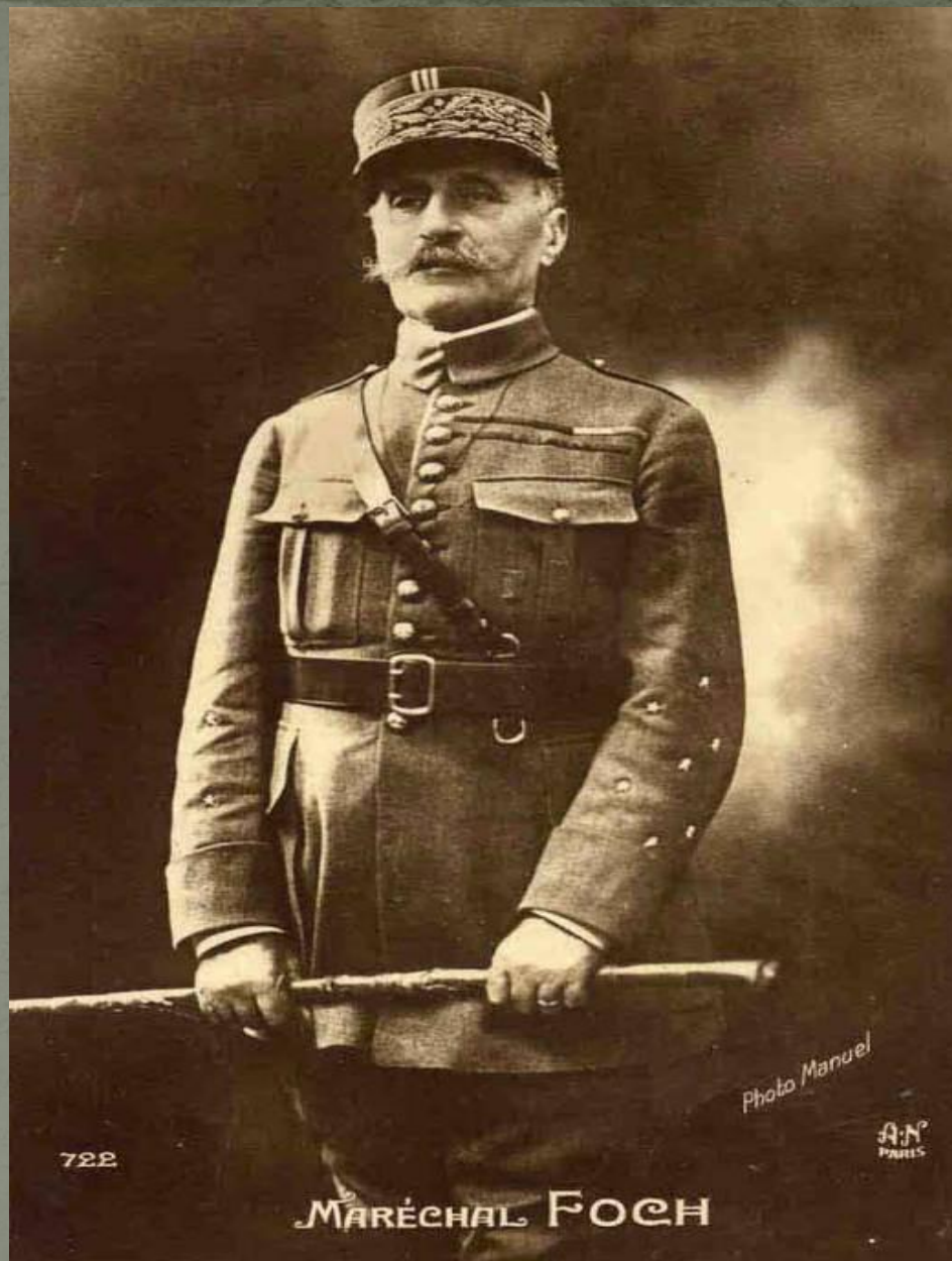
Французский генерал Ф. Фош