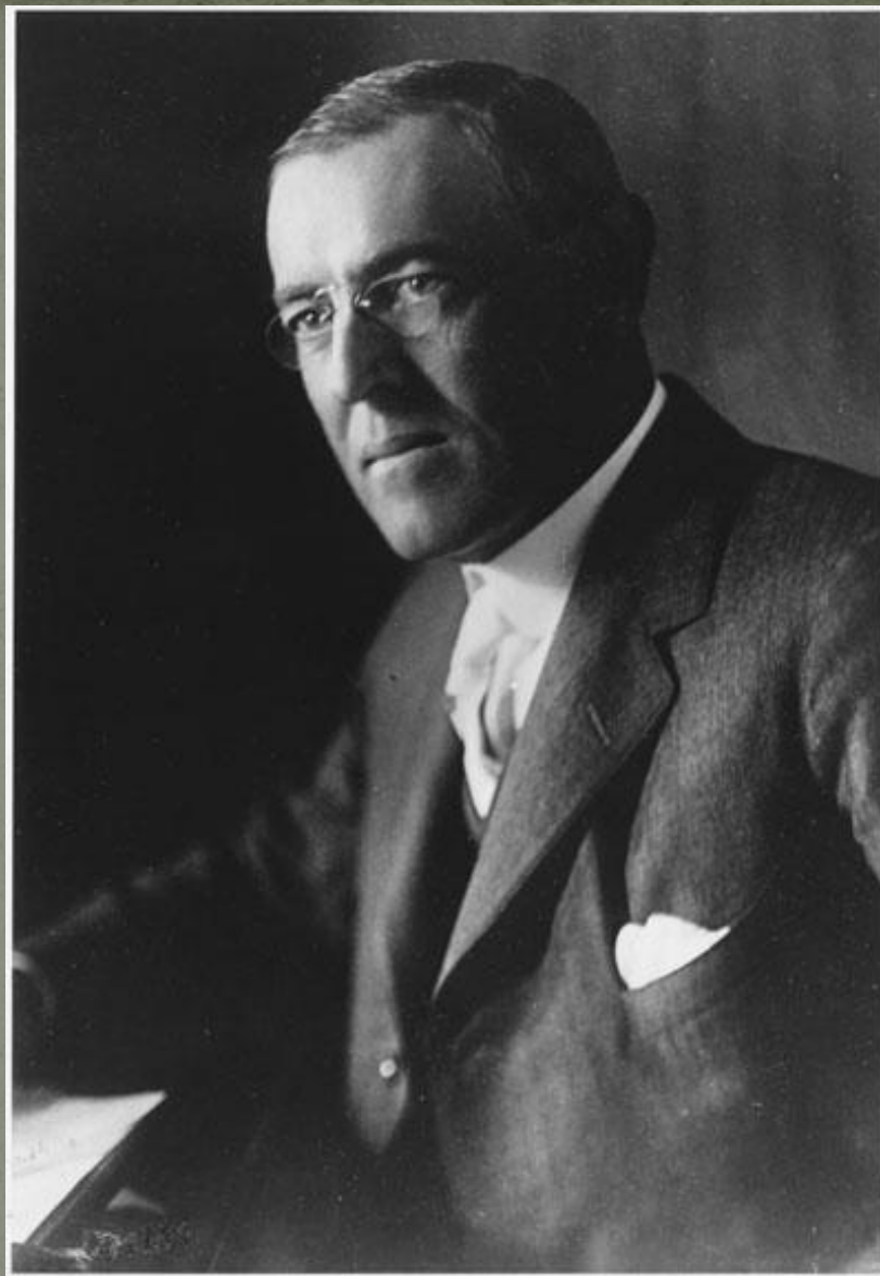
Вудро Вильсон(американский президент)