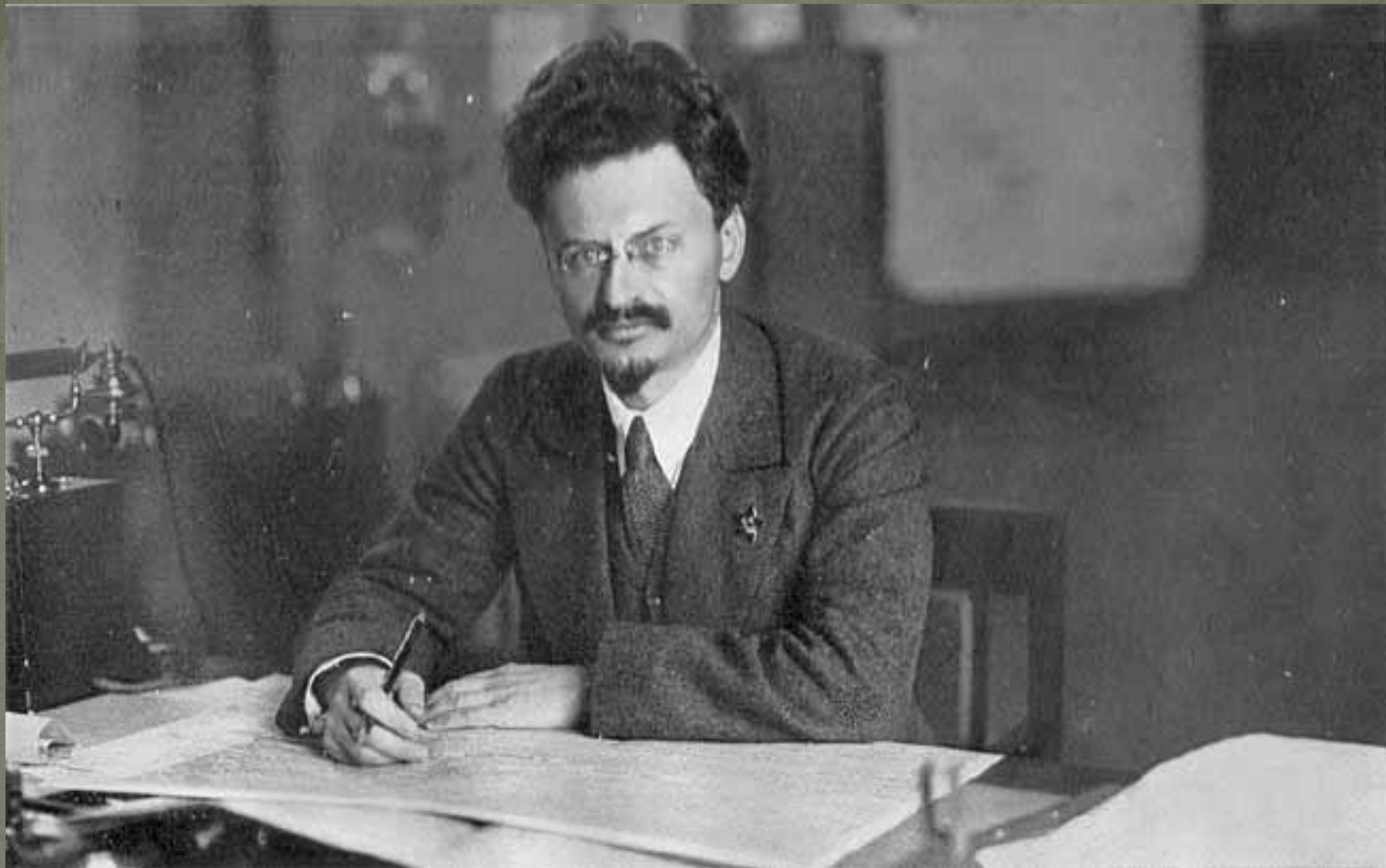
Лев Давидович Троцкий