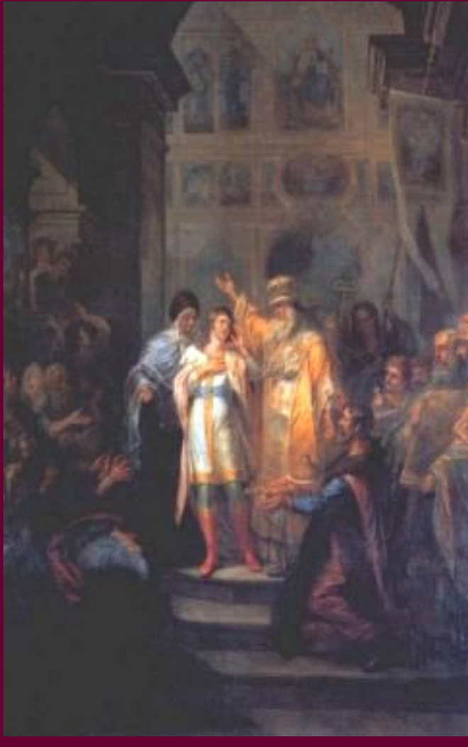
Г. Угрюмов. Призвание Михаила Федоровича Романова на царство.

После освобождения Москвы вновь встал вопрос о власти и собрался Земский Со бор.