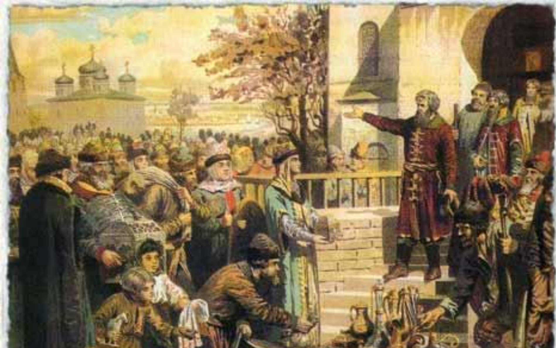
Кузьма Минин призывает к пожертвованию на народное ополчение