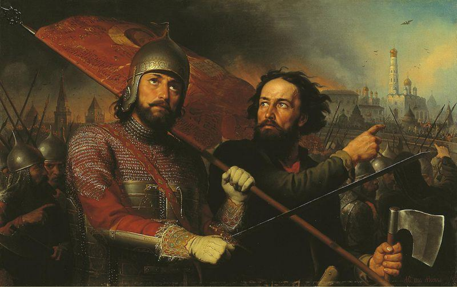
Кузьма Минин и Дмитрий Пожарский