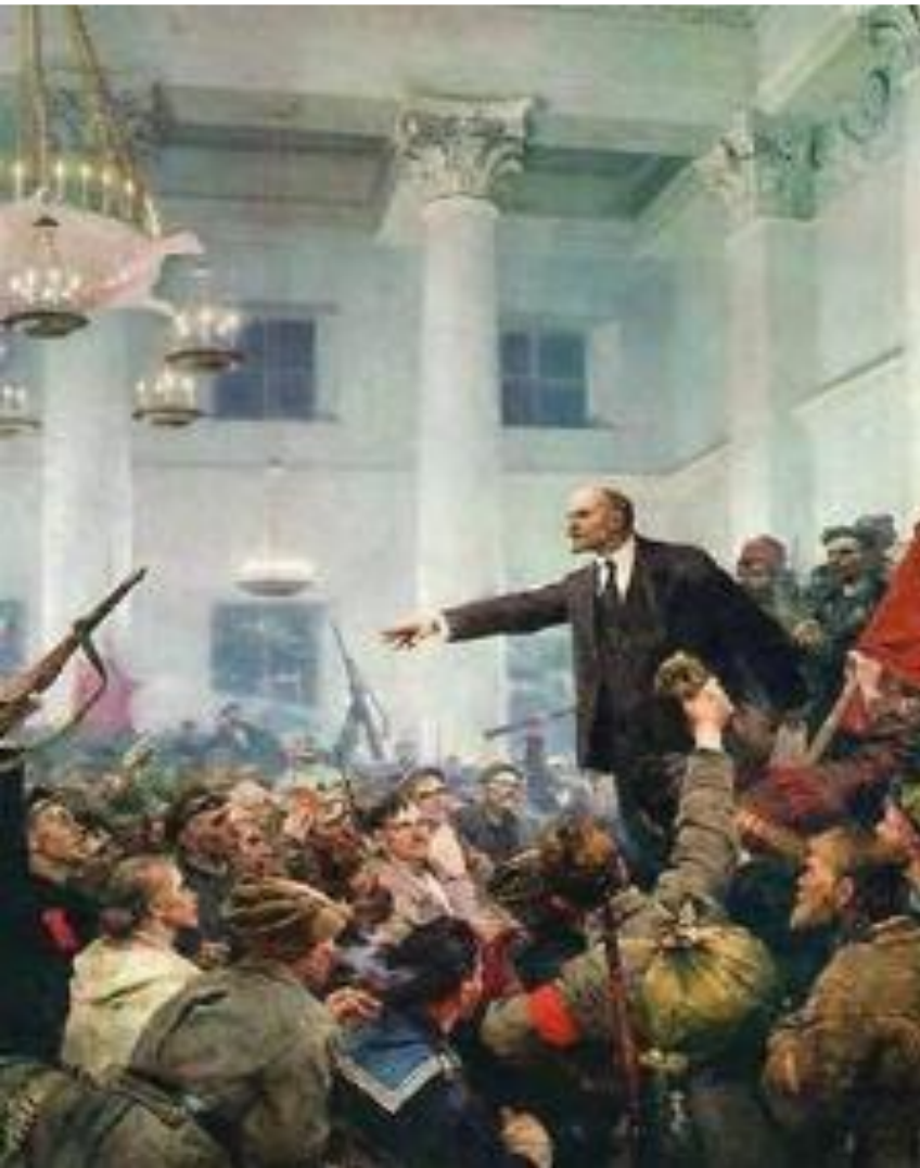
Ленин провозглашает Советскую власть. (худ. В. Серов)

Вечером 25 октября в Смольном открылся II Всероссийский съезд Советов. Меньшевики и правые эсеры в знак протеста покинули его, но большевики и левые эсеры имели достаточно голосов, чтобы съезд был правомочен решать судьбу страны.