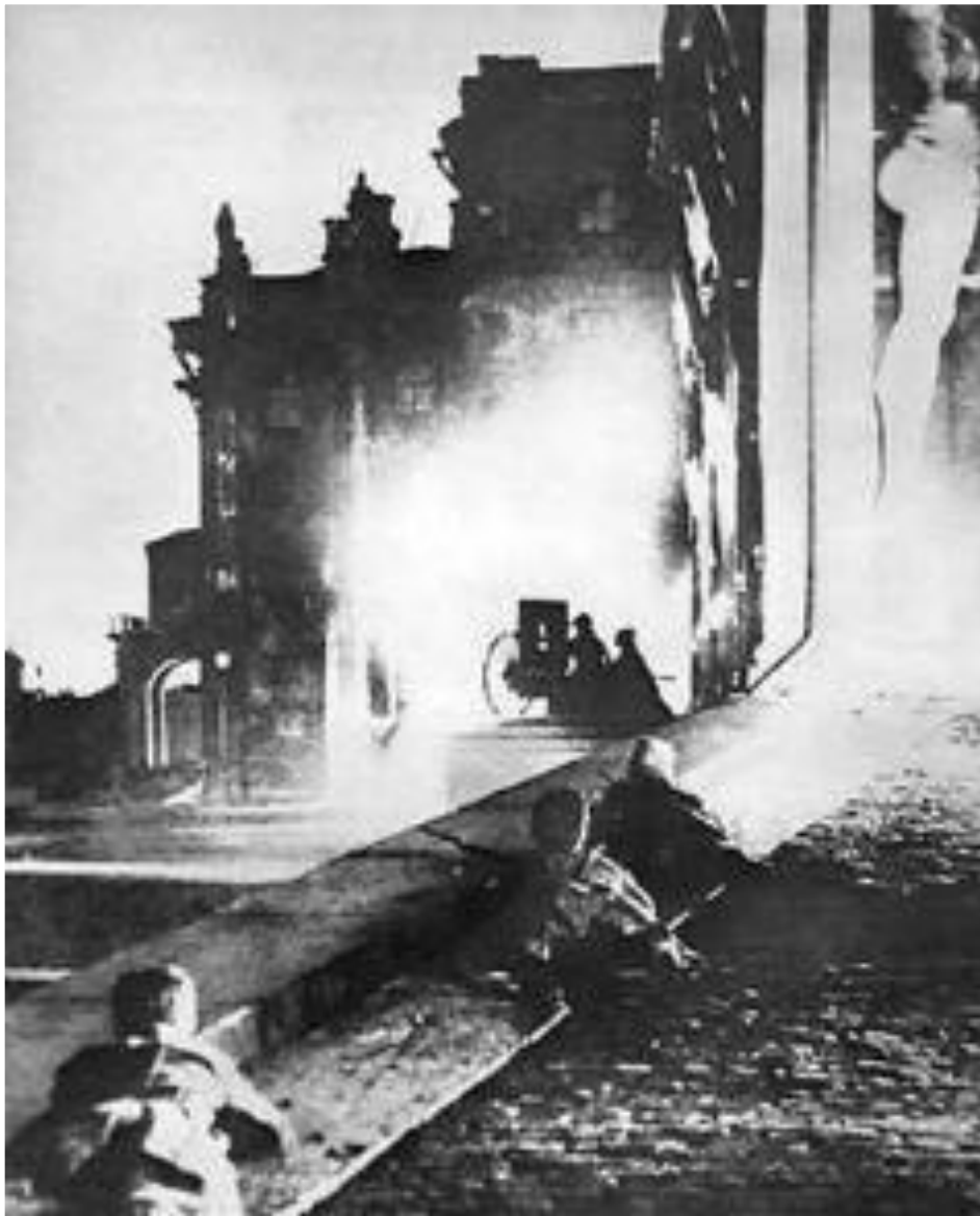
Штурм Зимнего дворца

24 октября правительство закрыло типографию печатавшую большевистскую газету. В ответ красногвардейцы заняли вокзалы, мосты, почту, телеграф, телефон.