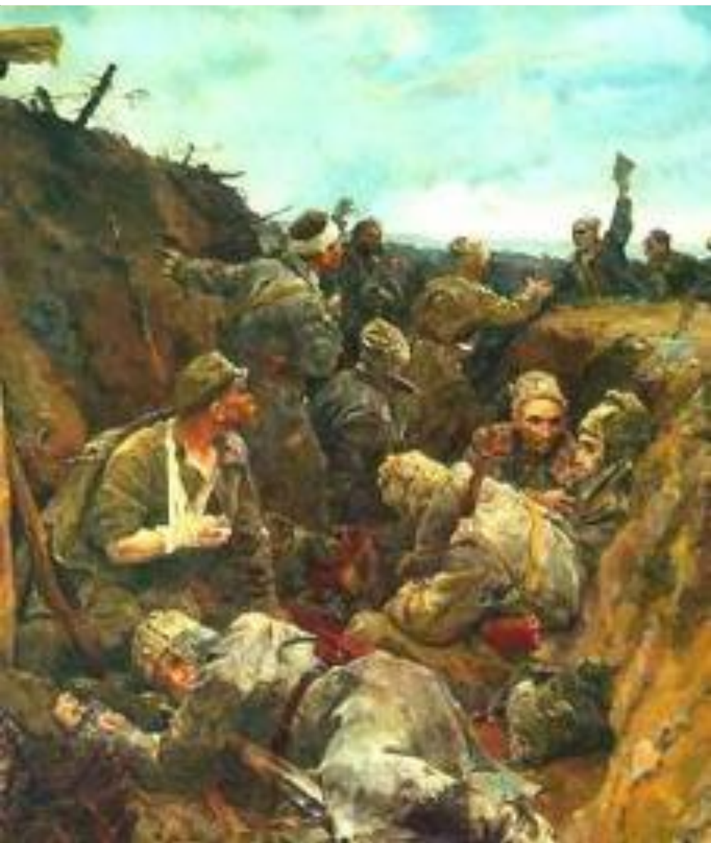
Декрет о мире. ( худ. В. Серов)

В повестку дня были включены «Декрет о мире», «Декрет о земле», «Декрет о правительстве».