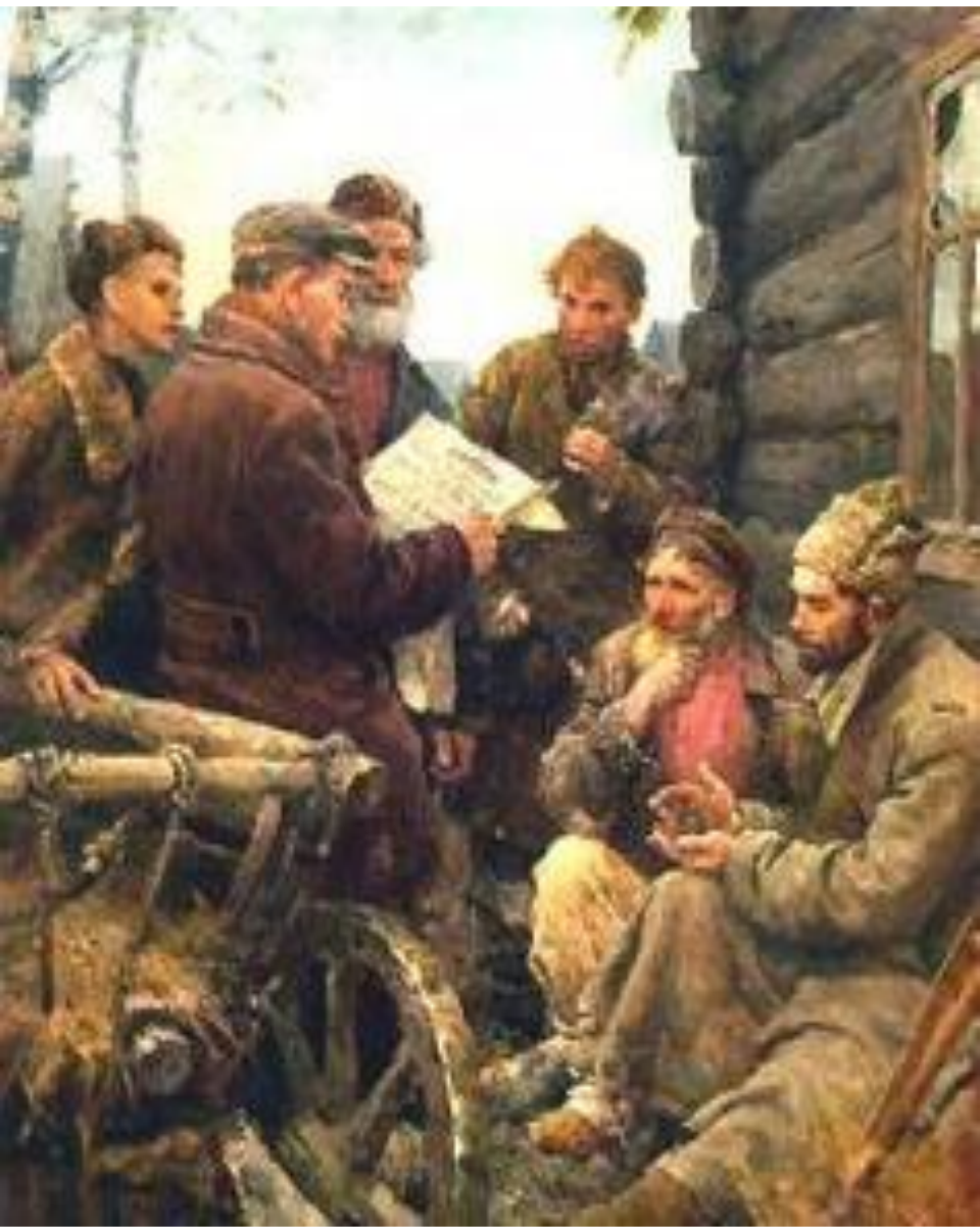
Декрет о земле. (худ. В. Серов)

«Декрет о земле» был составлен на основе 242 крестьянских наказов собранных еще летом эсерами. Он провозглашал: