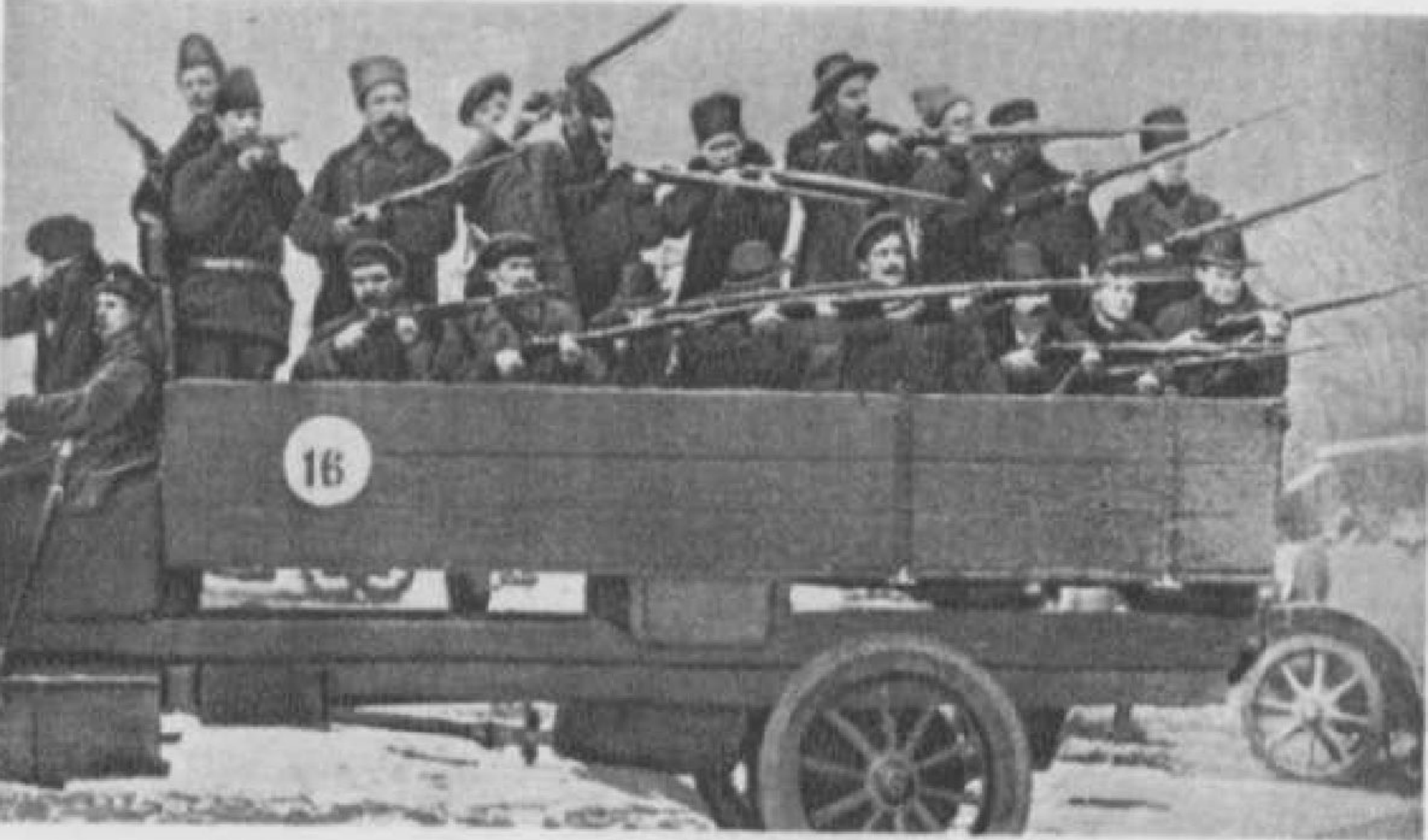
Красногвардейцы на грузовике в Октябрьские дни 1917. Петроград.