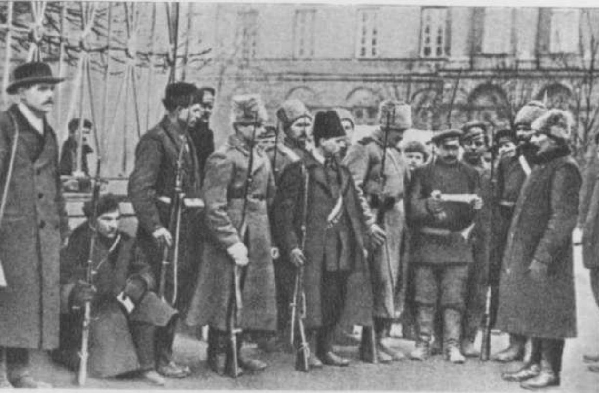
Красногвардейцы у ворот Смольного. Петроград. 1917.