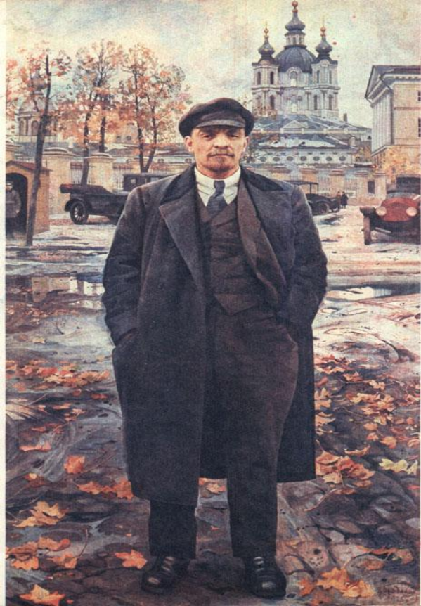
В.И. Ленин «Апрельские тезисы»