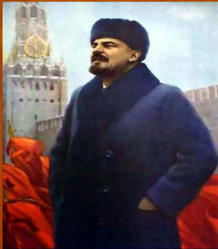
ВЛАДИМИР ИЛЬИЧ ЛЕНИН