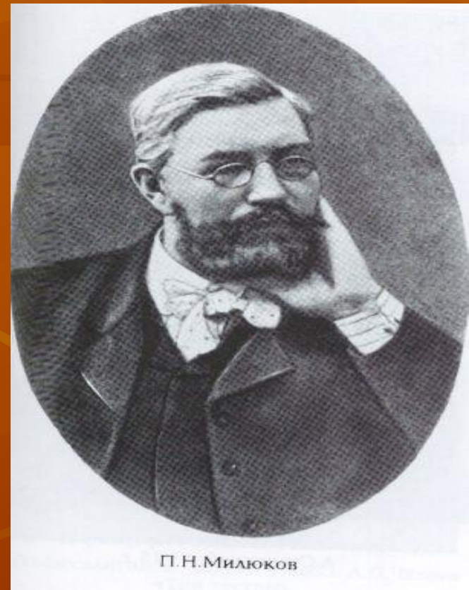
П.Н. Миллюков «Нота Миллюкова»