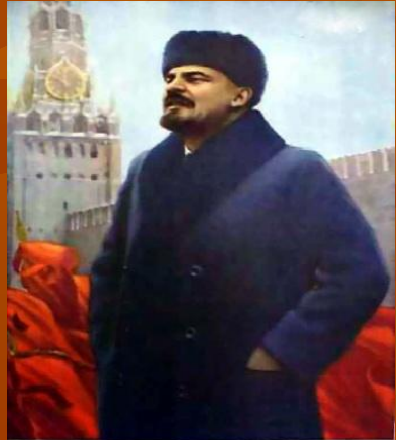
ВЛАДИМИР ИЛЬИЧ ЛЕНИН