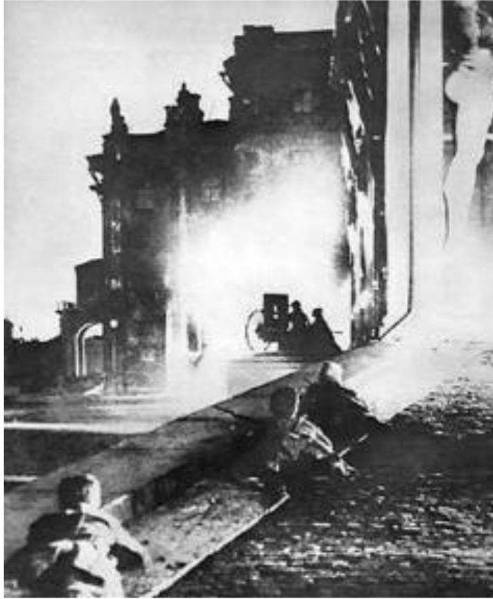
Штурм Зимнего дворца

24 октября правительство закрыло типографию печатавшую большевистскую газету «Рабочий путь». В ответ красногвардейцы заняли вокзалы, мосты, почту, телеграф, телефон.