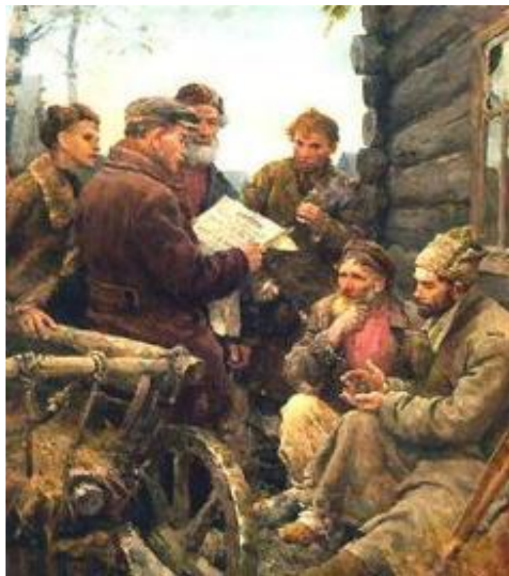
В. Серов. Декрет о земле.

«Декрет о земле» был составлен на основе 242 крестьянских наказов собранных еще летом эсерами. Он провозглашал: -отмену частной собственности на землю, -получение земли теми, кто ее обрабатывает -вводилось уравнительное землепользование в зависимости от местных условий, -вся земля поступает в общегосударственный фонд и периодически перераспределяется между крестьянами местными органами власти.