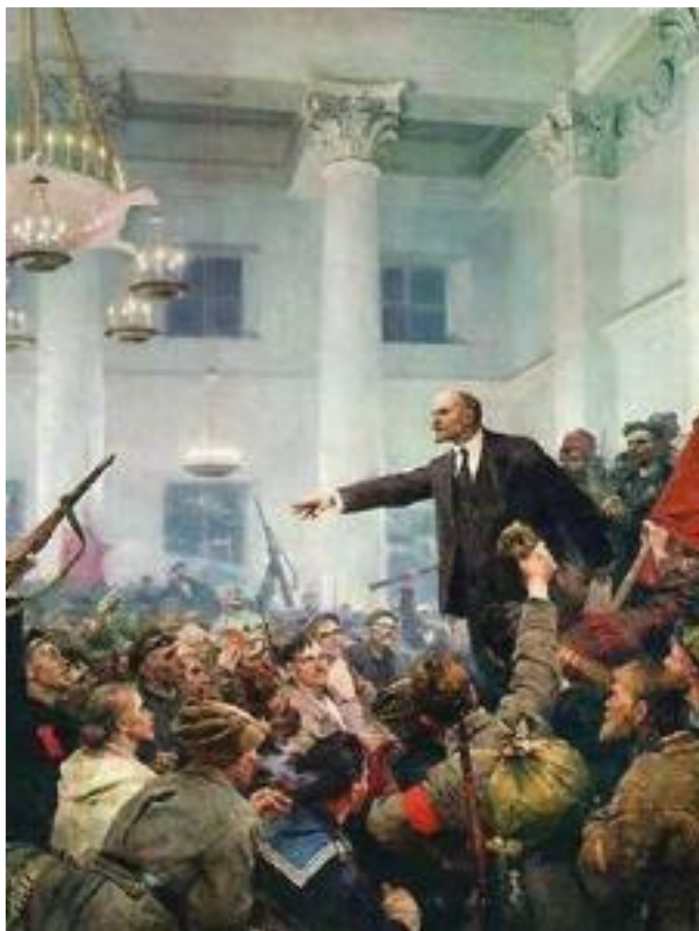
С. Серов. Ленин провозглашает Советскую власть.

Вечером 25 октября в Смольном открылся II Всероссийский съезд Советов. Меньшевики и правые эсеры в знак протеста покинули его, но большевики и левые эсеры имели достаточно голосов, чтобы съезд был правомочен решать судьбу страны.