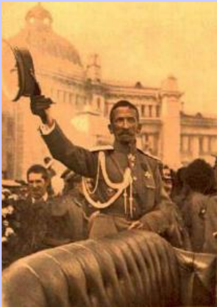
Приезд Л.Корнилова в Москву.

На совещании Корнилов и Керенский готовы были объявить о введении военных соединений, но рабочие Москвы не позволили этого сделать.