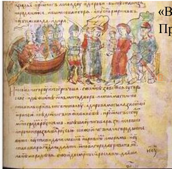
Олег показывает маленького Игоря Аскольду и Диру. Миниатюра из Радзивилловской летописи (XV век).