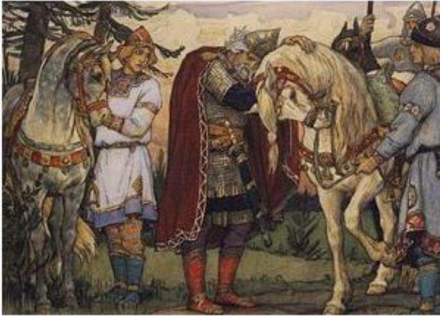
Прощание Вещего Олега с конем. В. Васнецов, 1899