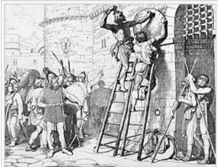
Олег прибывает щит свой к вратам Царьграда. Гравюра Ф. А. Бруни, 1839.

Многие историки считают этот поход легендой.