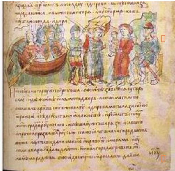
Олег показывает маленького Игоря Аскольду и Диру. Миниатюра из Радзивилловской летописи (XV век).