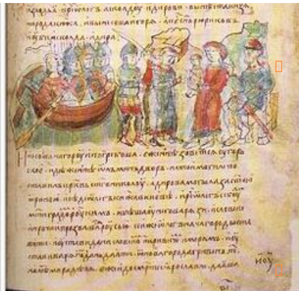
Олег показывает маленького Игоря Аскольду и Диру. Миниатюра из Радзивилловской летописи (XV век).