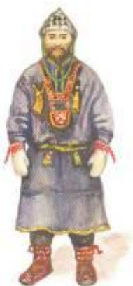
Мужчина в лопе-машх с оловянными нагрудником