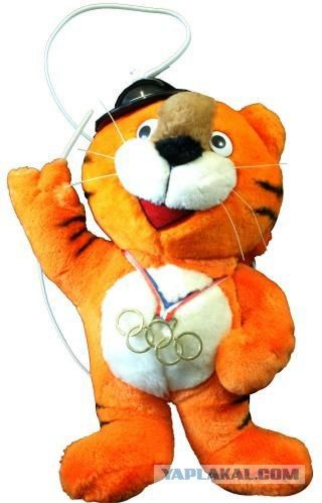
Ходори: талисман Олимпийских летних игр в 1988 в Сеуле, Южная Корея