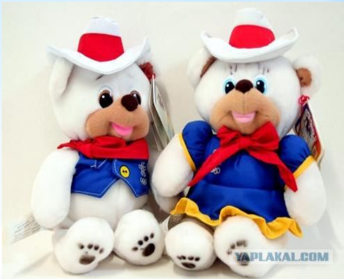
Хайди и Хоуди: талисманы Зимних Олимпийских игр 1988 в Калгари, Канада