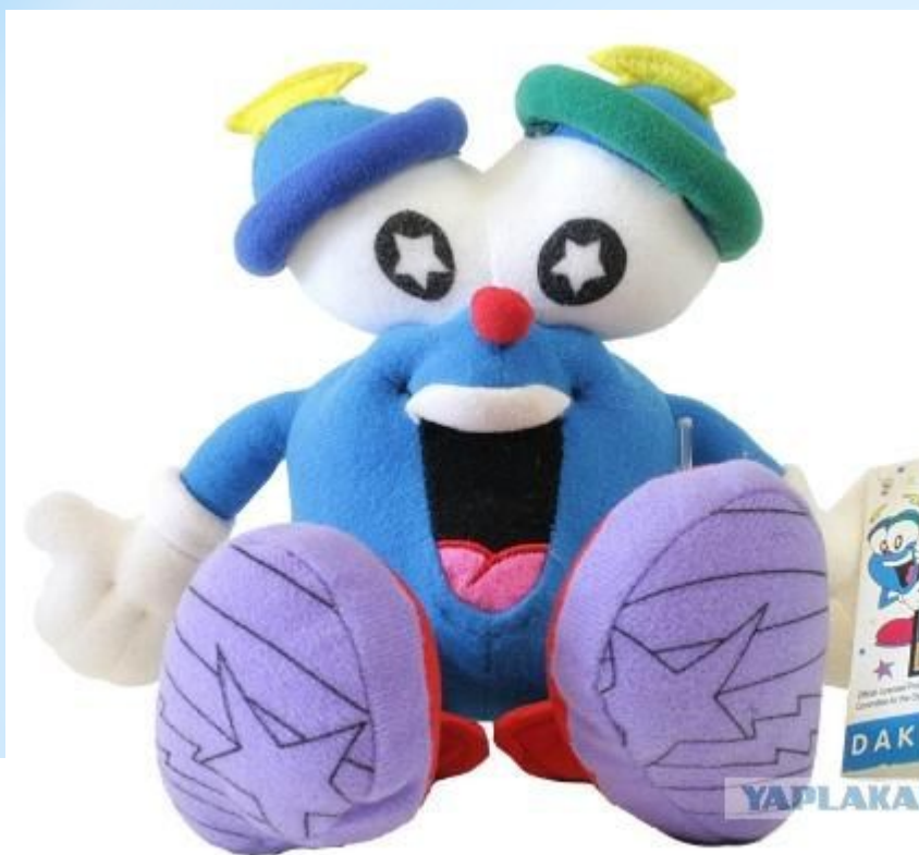
Иззи: Олимпийские Летние игры, в 1996, в Атланте, США