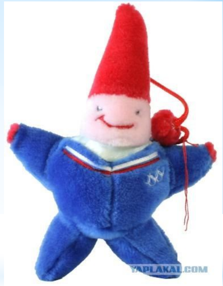
Magique (Магия): Зимние Олимпийские игры, 1992, Альбертвилль, Франция