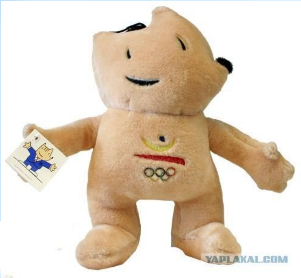
Коби: Олимпийские Летние игры, 1992, в Барселоне, Испания