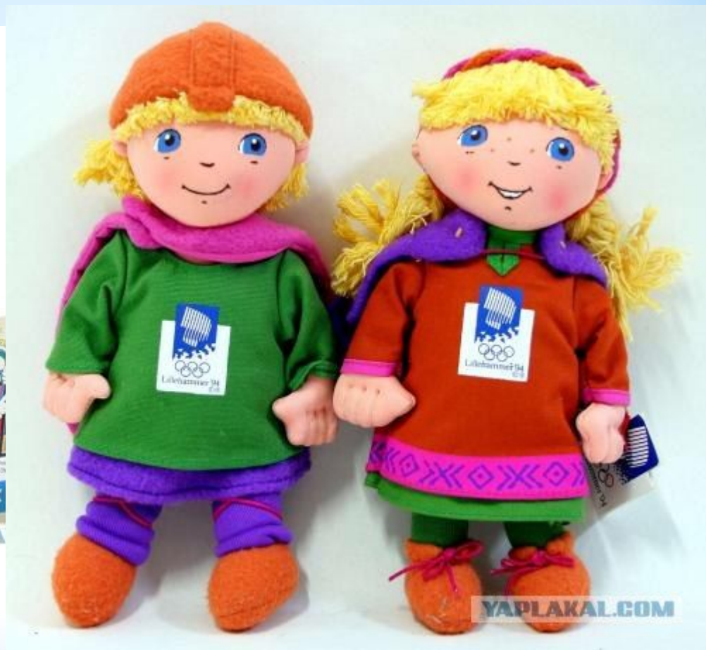
Хокон и Кристин : талисманы Зимних Олимпийских игр 1994 в Лиллехаммере, Норвегия