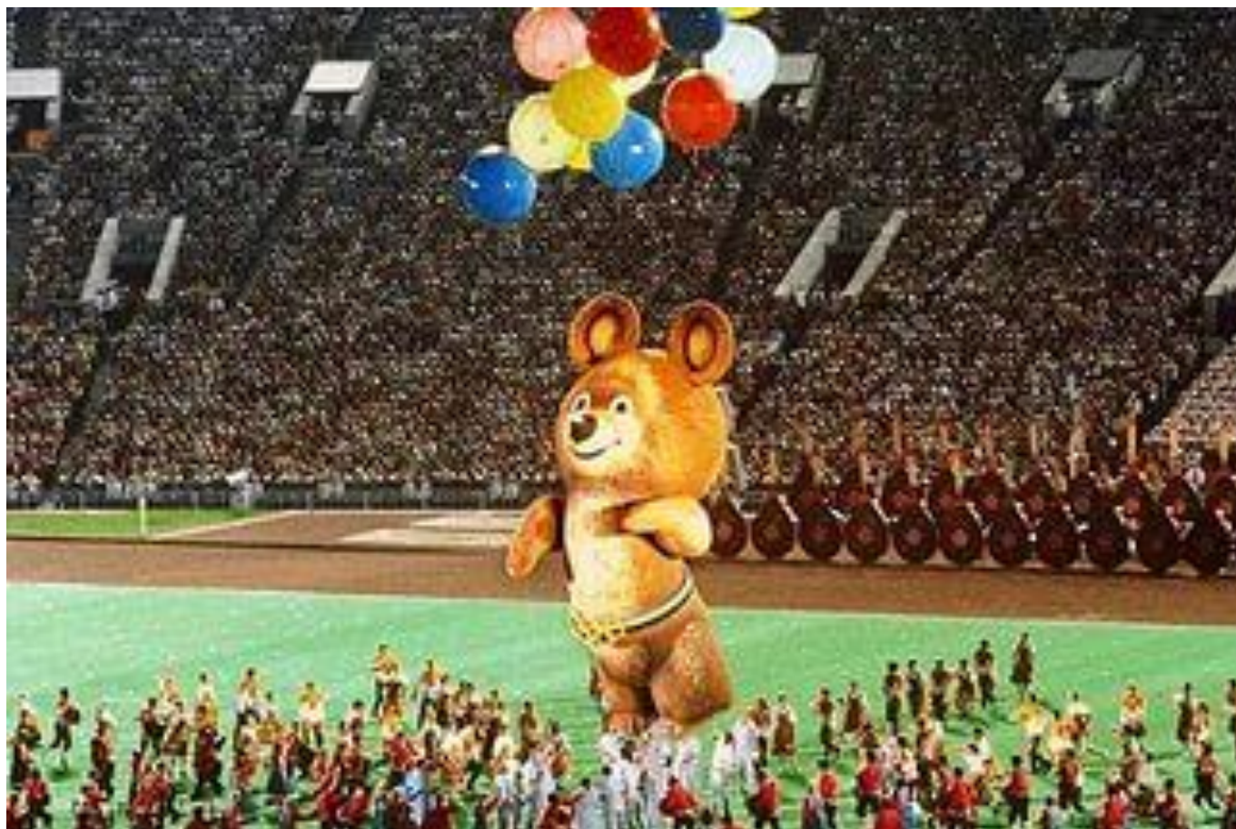
Олимпийские игры в СССР