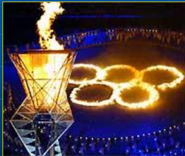
Афины, 2004 год

Ритуал зажжения священного огня происходит от древних греков и был возобновлен Кубертенем в 1912 году. Факел зажигают в Олимпии направленным пучком солнечных лучей, образованных вогнутым зеркалом. Олимпийский огонь символизирует чистоту, попытку совершенствования и борьбу за победу, а также мир и дружбу. Традиция зажигать огонь на стадионах была начата в 1928 году (на зимних Играх – в 1952 году). Эстафета по доставке факела в город-хозяин Игр впервые состоялась в 1936 году.