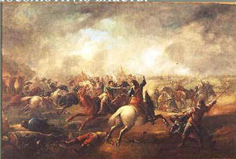
Бой при Марстон-Муре