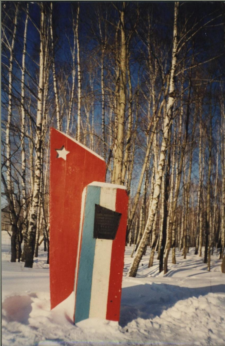
Памятник в д. Хатенки, Козельского района Калужской области