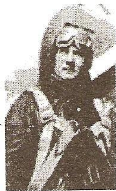
Борис Литвинчук после полета

Борис Литвинчук, герой Советского Союза, почетный гражданин г. Калуга.