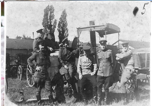
Серед фронтових друзів. Червень 1944 року.

С 1945 по 1948 год служил в комендатуре г. Дрездена