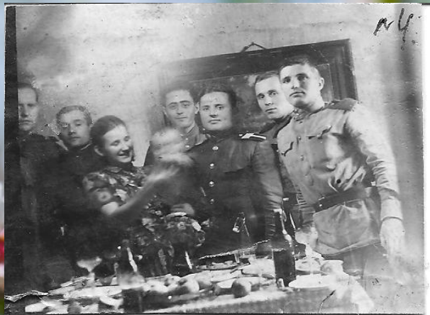
Зустріч нового року з військовими друзями

Воевал на Калининском Фронте, под Смоленском, на Курской дуге, принимал участие во взятии Берлина