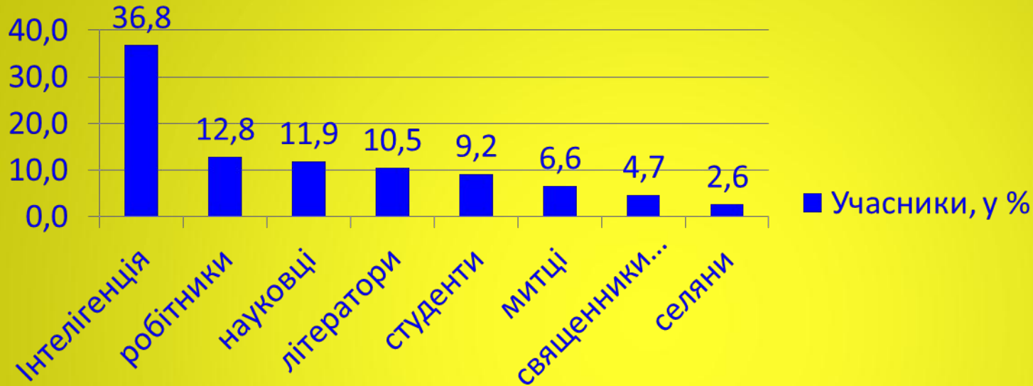
Учасники, у %

На основі даних діаграм визначте соціальний та статевий склад учасників опозиційного руху. Зробіть висновки