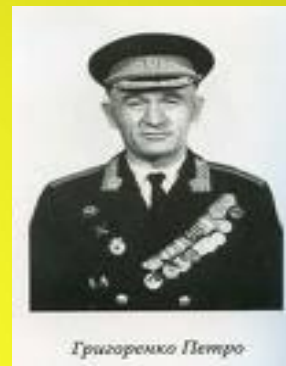
Григоренко Петро Петро Григоренко