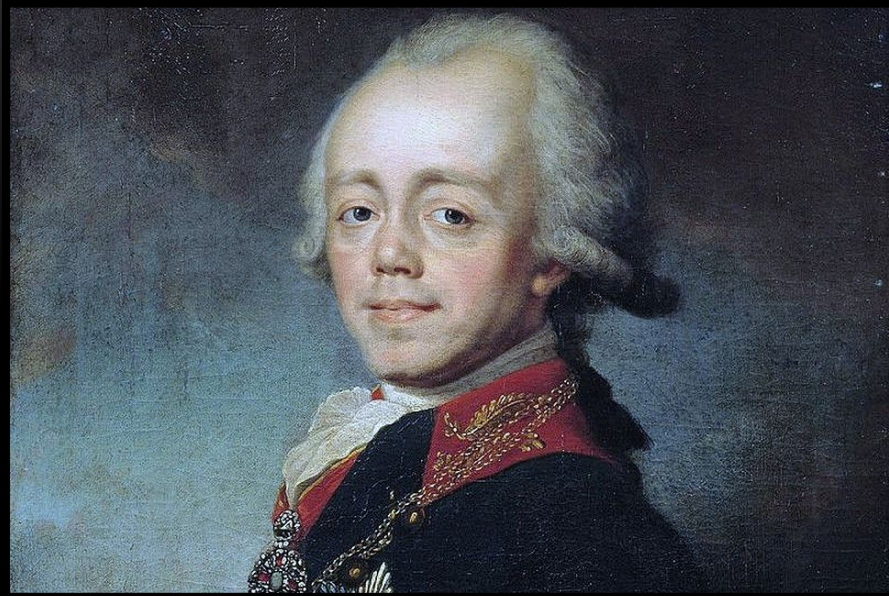
Павел I Петрович