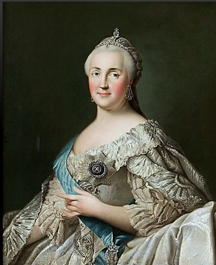
Екатерина II Великая

В 1745 году его женили на принцессе Екатерине Алексеевне, будущей Екатерине II. Считается, что до начала 1750-х годов между мужем и женой вообще не было супружеских отношений, но затем Петру была сделана некая операция после которой в 1754 году Екатерина родила ему сына, будущего императора Павла I. Пётр никогда не скрывал от жены своих увлечений другими женщинами, так же как и она, никогда не скрывала большего количества своих любовников.