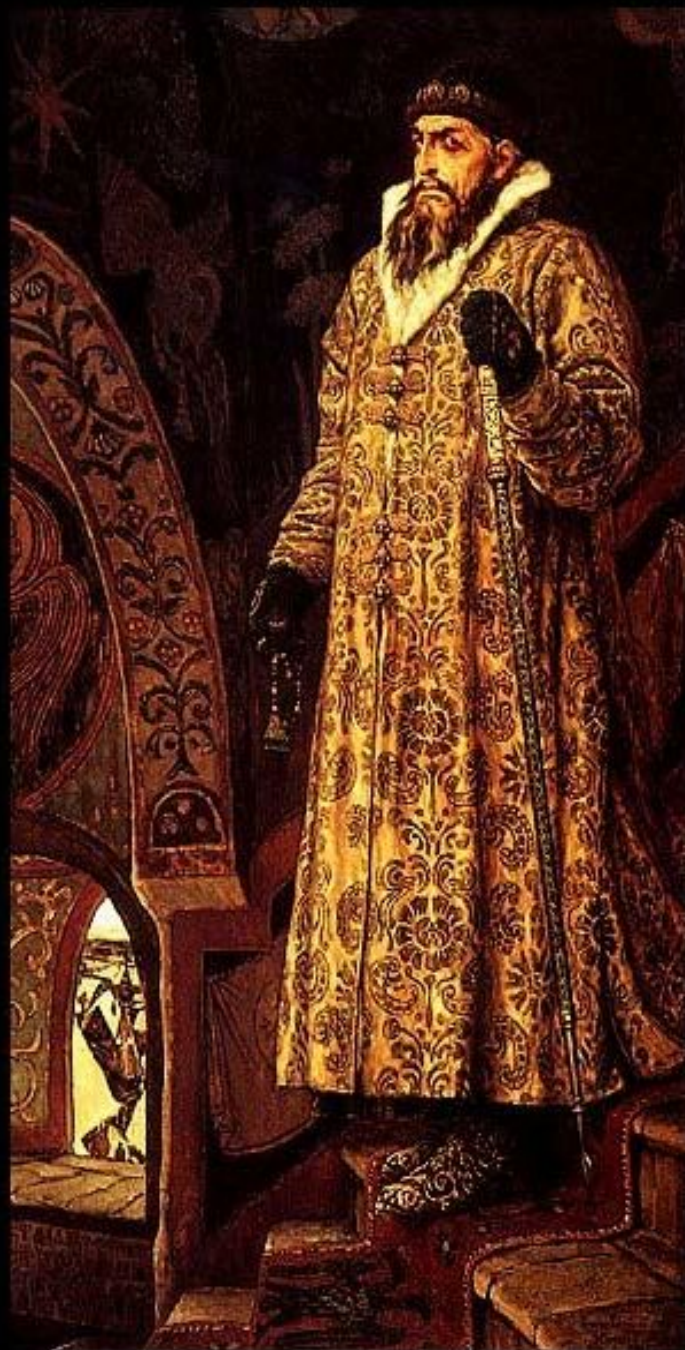
Васнецов В.М. "Царь Иван Васильевич Грозный". 1897 холст, масло. ГТГ