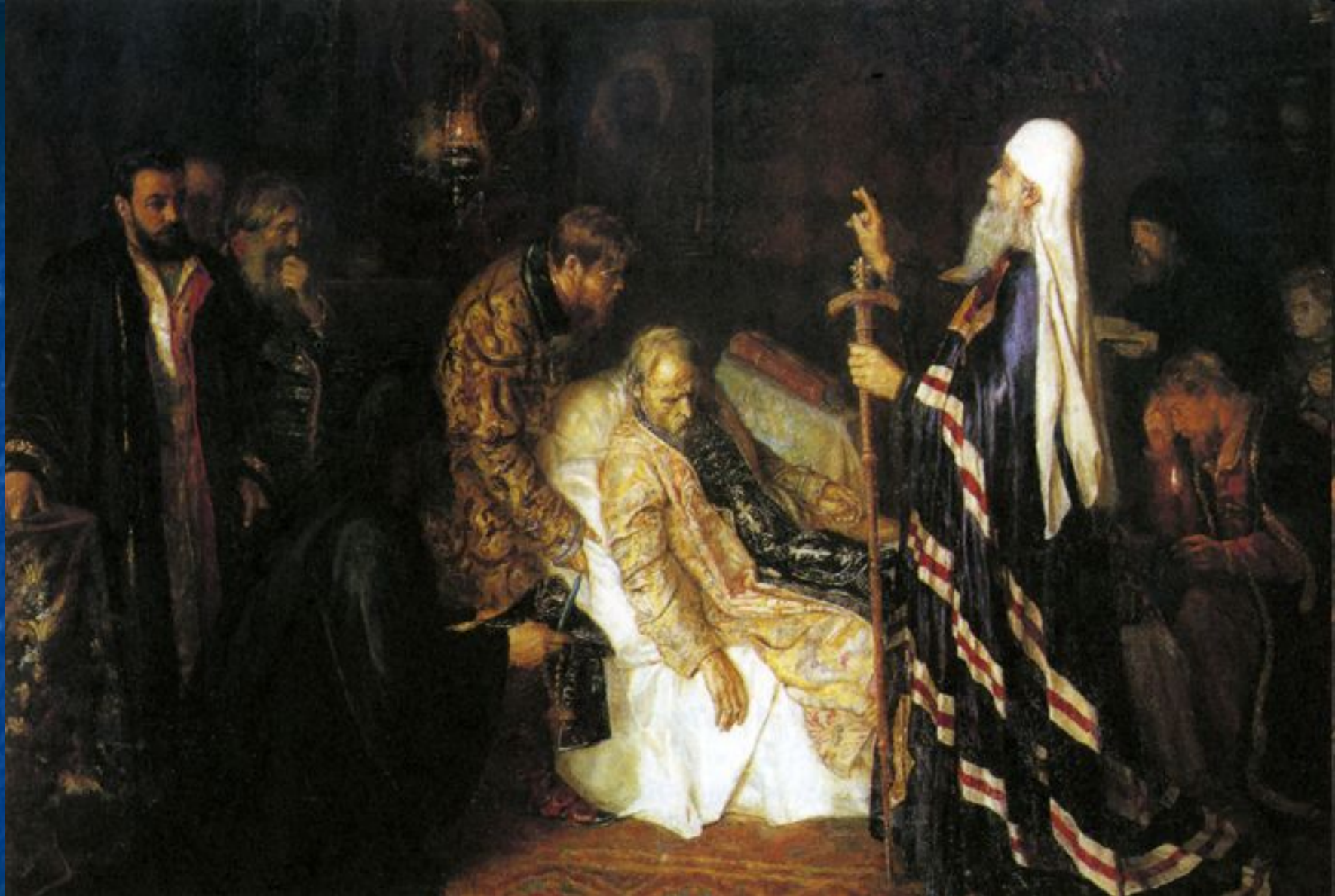
"Кончина Ивана Грозного" худ. К. Геллер