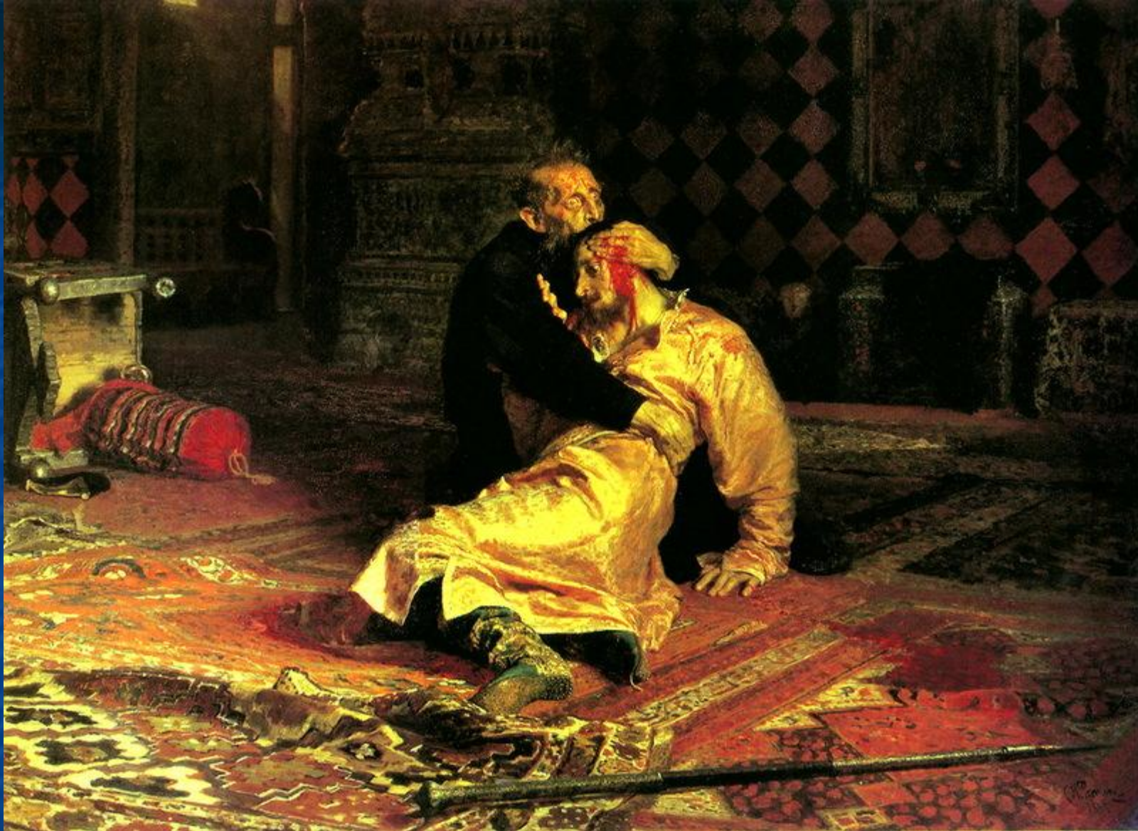
Художник И.Е.Репин. «Иван Грозный и сын его Иван 16 ноября 1581 года»