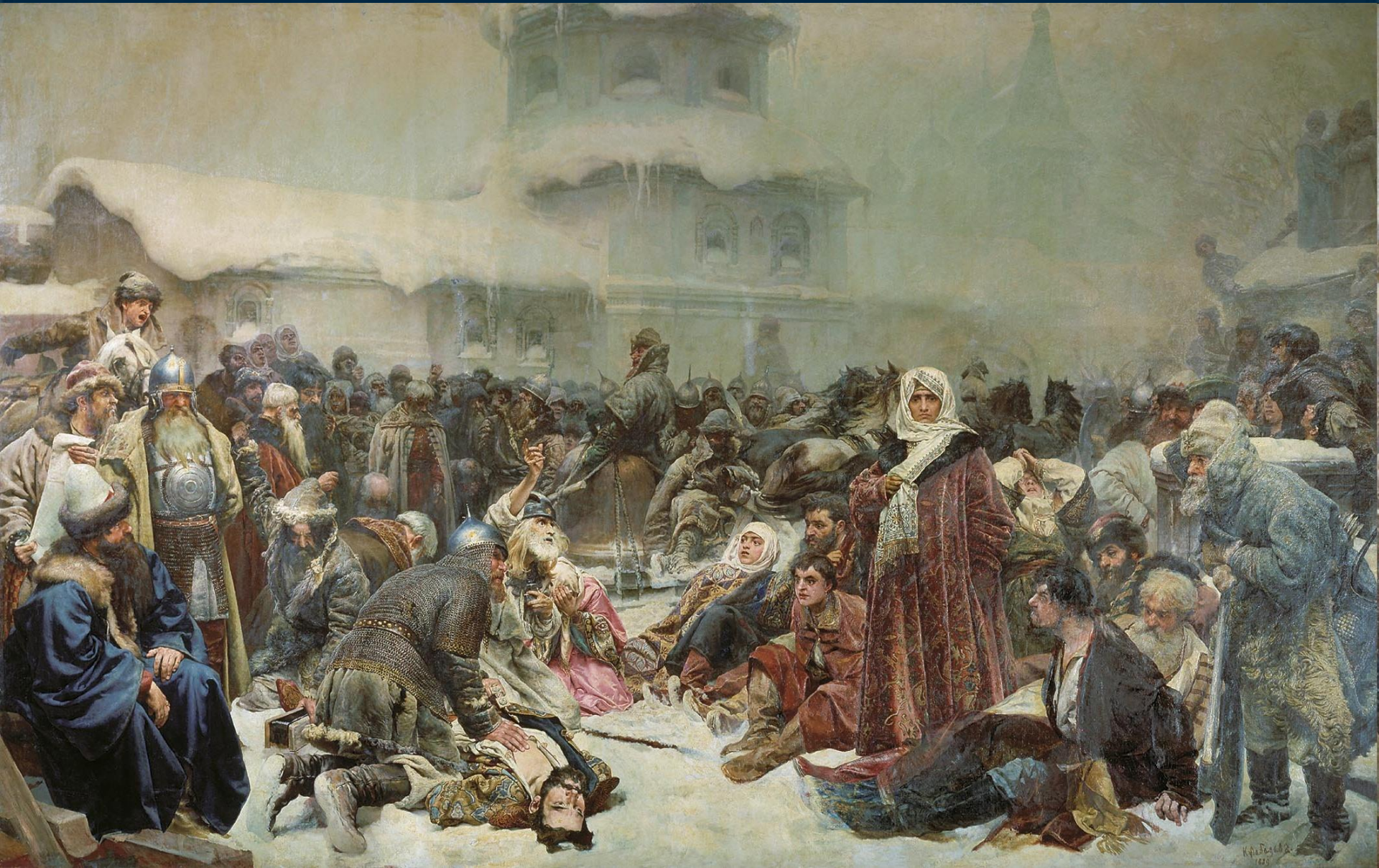
Лебедев К.В. Уничтожение новгородского веча.