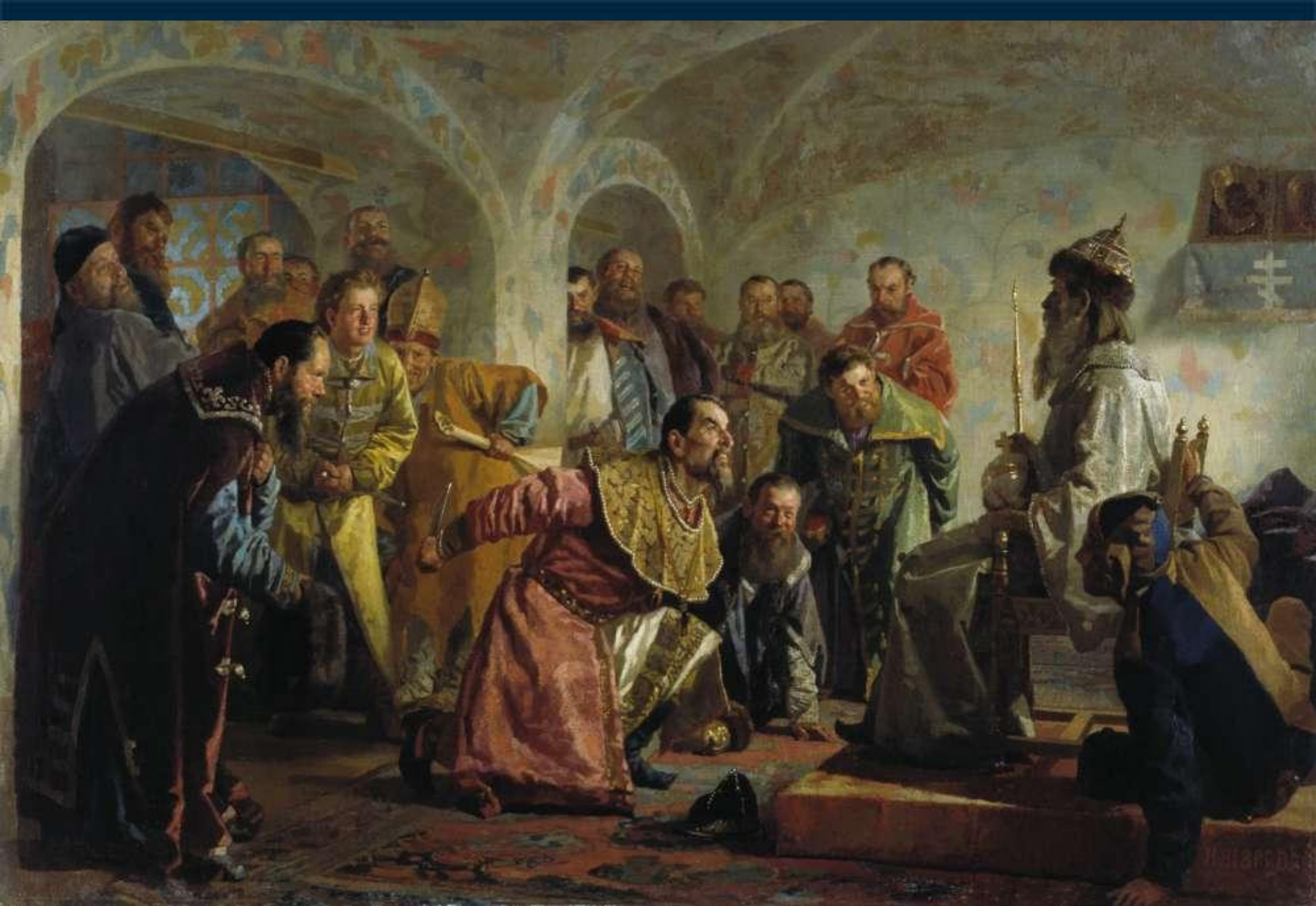
Опричники. Худ. Неврев