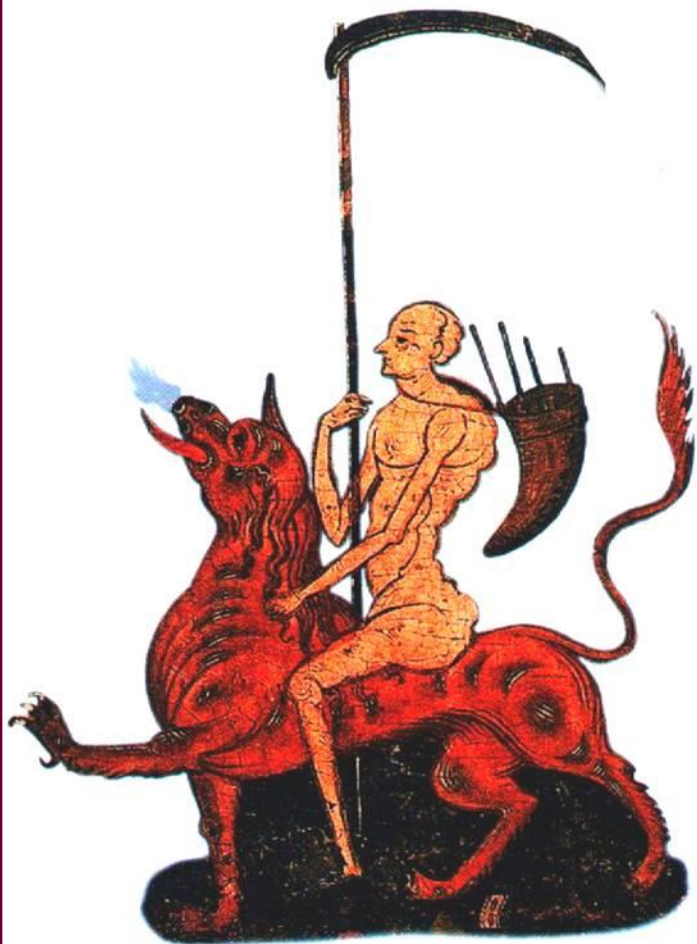
Черт-опричник. Миниатюра 16 в.

В период опричнины грозный добился резкого усиления своей власти. Однако это было достигнуто огромной ценой. Страна была разорена опричниками, -Ливонской войной, набегами татар.