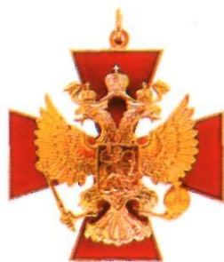
Орден «За заслуги перед Отечеством» III степени