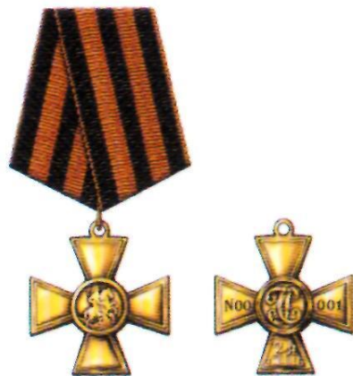
Знак отличия — Георгиевский Крест II степени