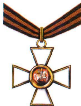
Орден Святого Георгия III степени