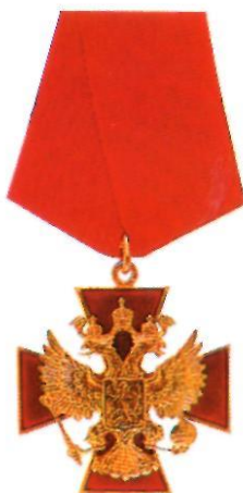
Орден «За заслуги перед Отечеством» IV степени

II степень. Тот же знак. Носится на шее на ленте шириной 45 мм. При знаке такая же звезда.