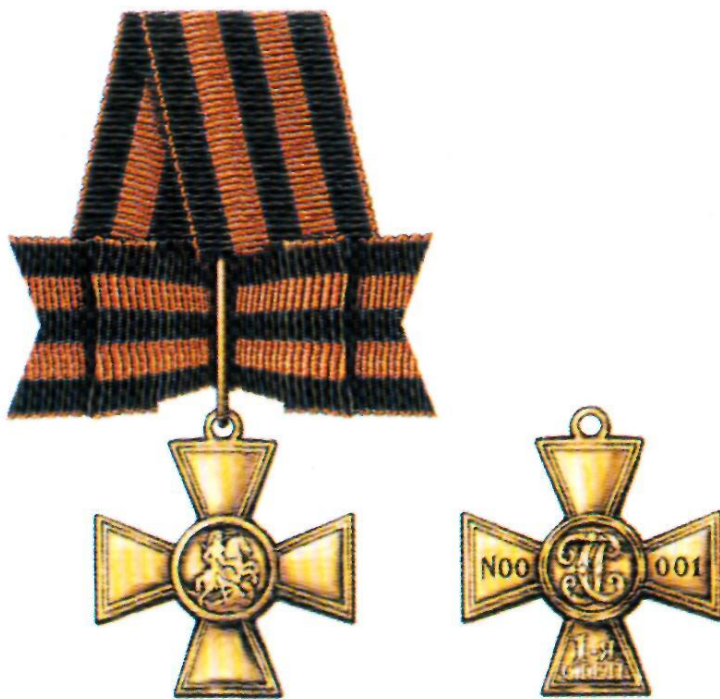
Знак отличия — Георгиевский Крест I степени

Знак отличия Военного ордена был учреждён в 1807 г., в 1913 г. он получил название Георгиевский Крест. Восстановлен 2 марта 1992 г.