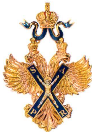
Звезда и знак ордена Святого апостола Андрея Первозванного

Орден Святого апостола Андрея Первозванного является высшей государственной наградой Российской Федерации.