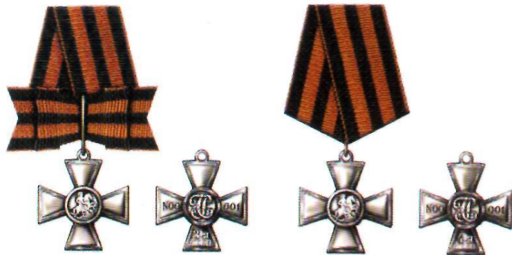
Знак отличия — Георгиевский Крест III степени