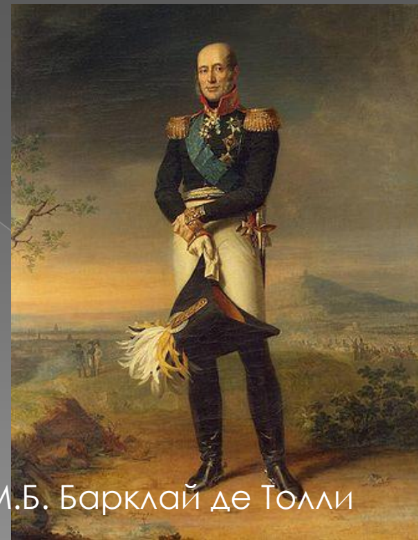
М.Б. Барклай де Толли