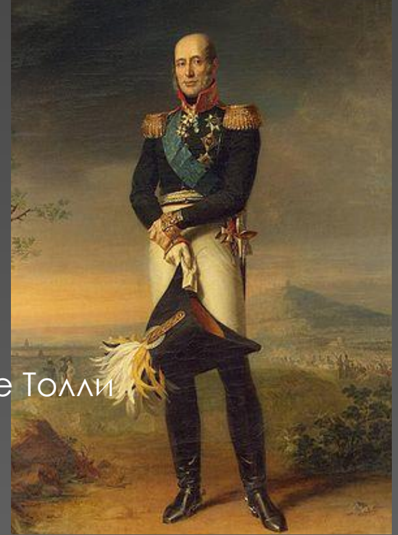
М.Б. Барклай де Толли