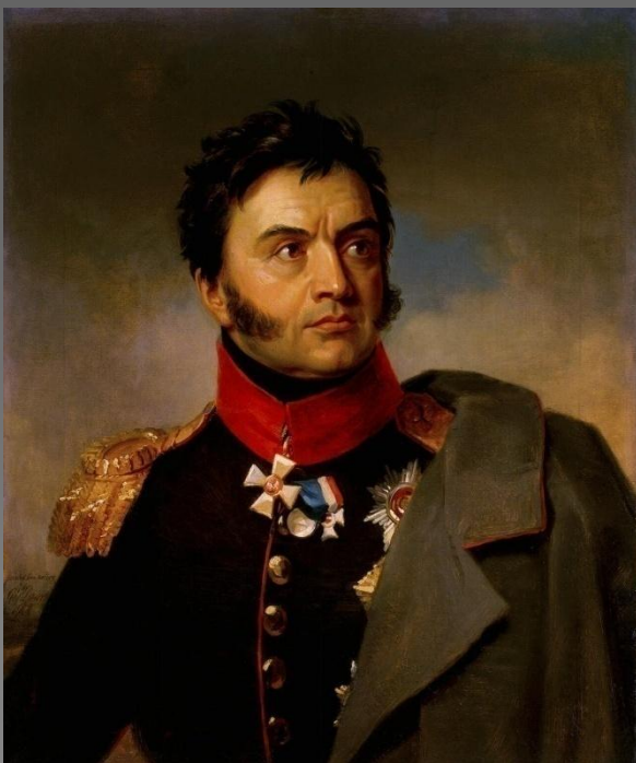
Н.Н. Раевский ☉

Орден Александра Невского за Бородинское сражение получили четыре героя Отечественной войны — генералы от инфантерии Д. С. Дохтуров и М. А. Милорадович и генерал-лейтенанты А. И. Остерман-Толстой и Н. Н. Раевский. При этом первые два отмечены орденом Александра Невского с бриллиантовыми украшениями, а двое следующих — без бриллиантов.