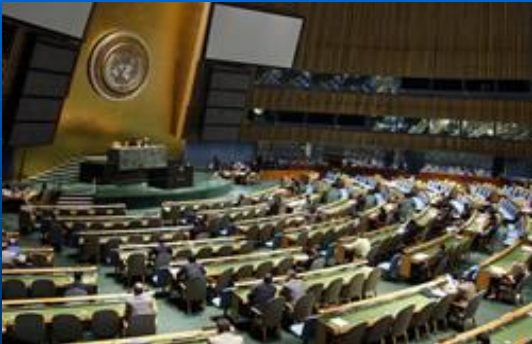
Сессия Генеральной Ассамблеи. Июль 2008 года.