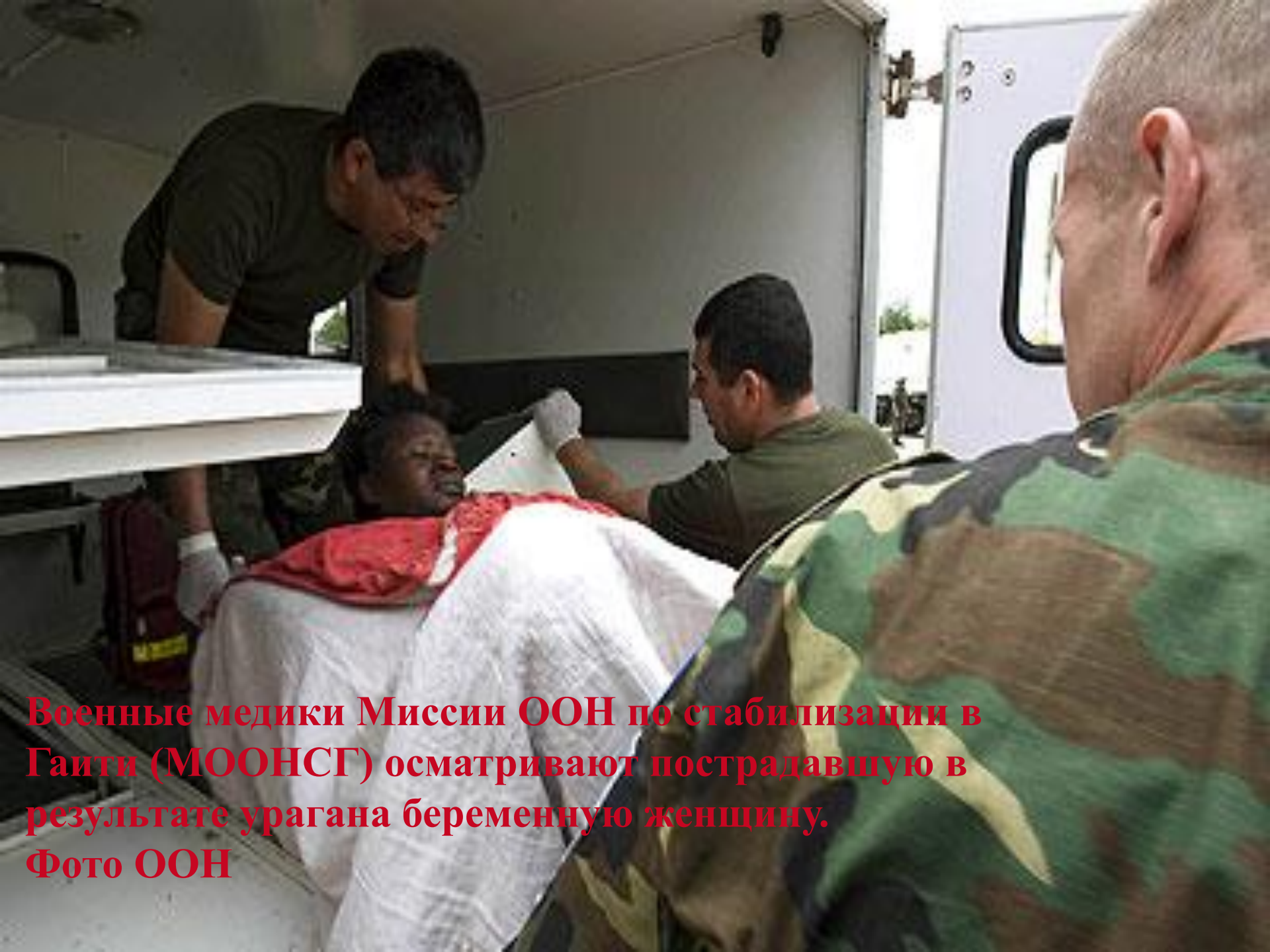
Военные медики Миссии ООН по стабилизации в Гаити (МООНСГ) осматривают пострадавшую в результате урагана беременную женщину.