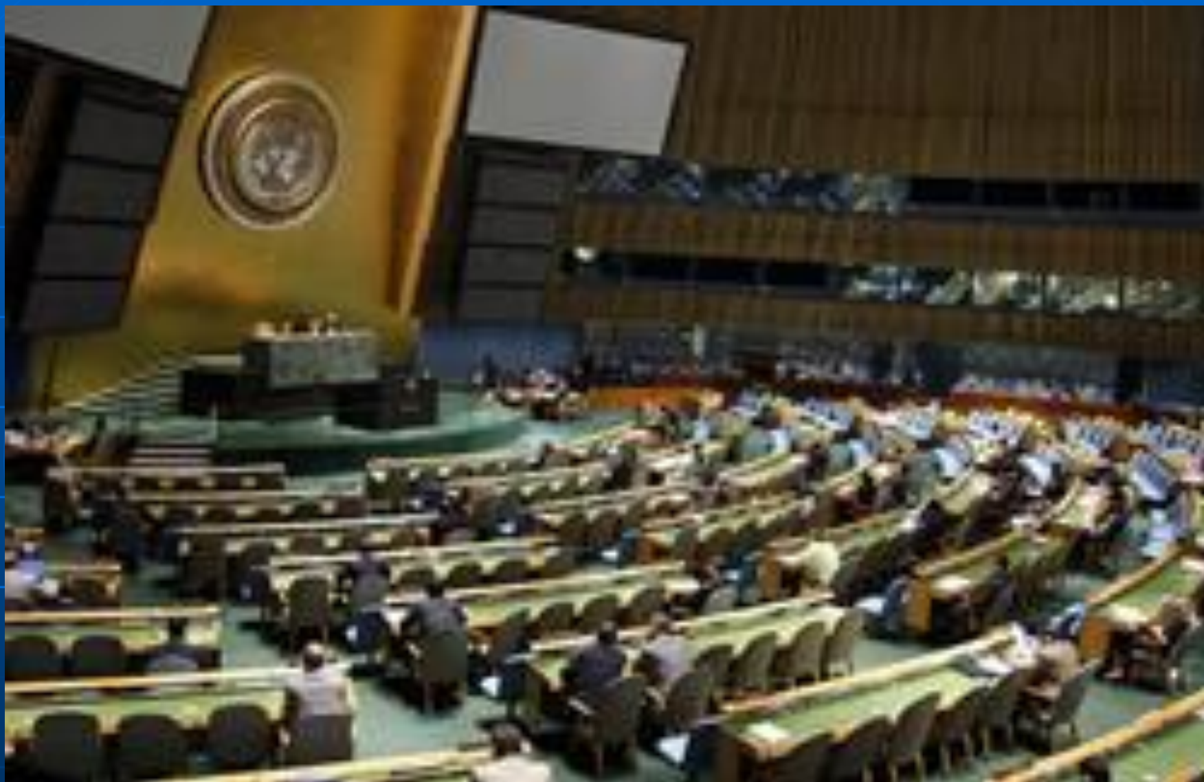
Сессия Генеральной Ассамблеи. Июль 2008 года.