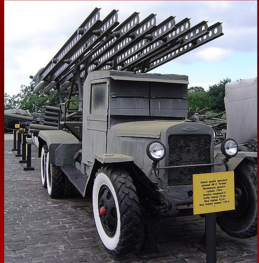
Войсковая машина реактивной артиллерии ДМ-13 "Муром". Максимальная дальность стрельбы 7200 м. Количество направляющих 16. Калибр орудий 122 мм. Масса орудия 42,1 т. Масса боевой машины 7200 кг.