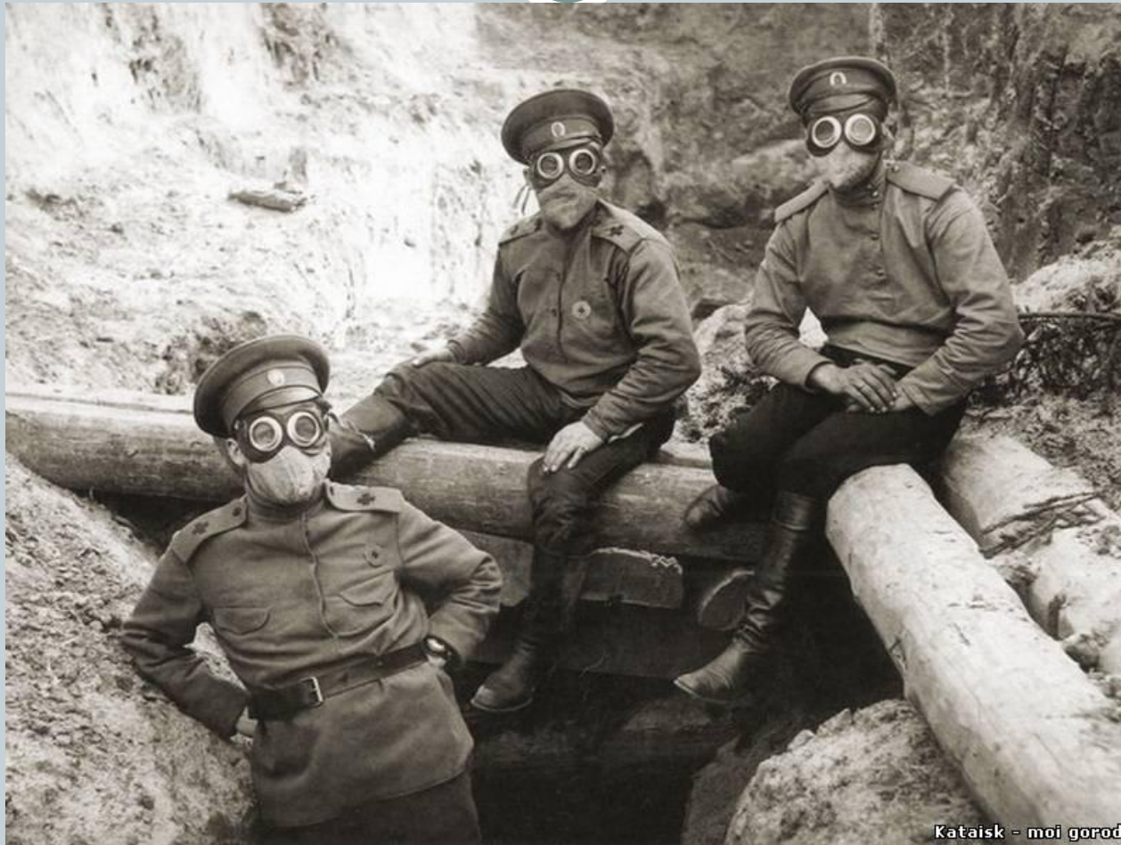
Kataisk - moi gorod

Вследствие применения химоружия и гибели большого количества солдат, было разработано и анти средство – противогаз.