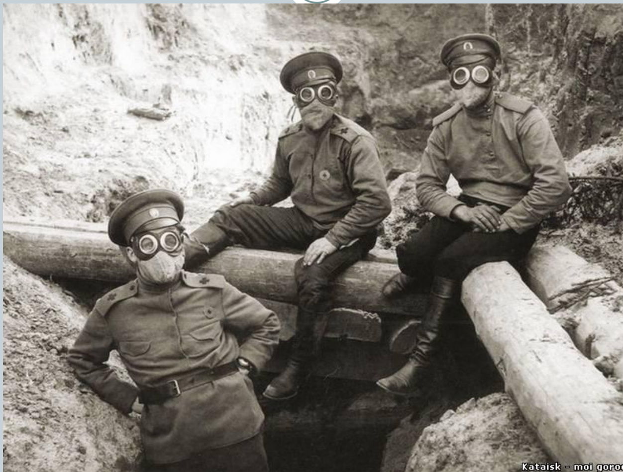
Kataisk - moi gorod

Вследствие применения химоружия и гибели большого количества солдат, было разработано и анти средство – противогаз.