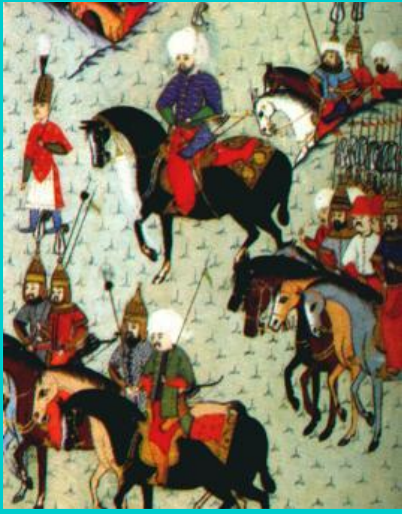
Поход янычар в Тунис. Миниатюра 16 в.

Империя держалась на силе оружия. Покоренные народы начали борьбу за свою свободу. Партизаны-гайдуки, жгли поселки мусульман, нападали на их отряды. Но они часто были излишне жестоки к мирным жителям и убивали даже славян, которые приняли ислам.