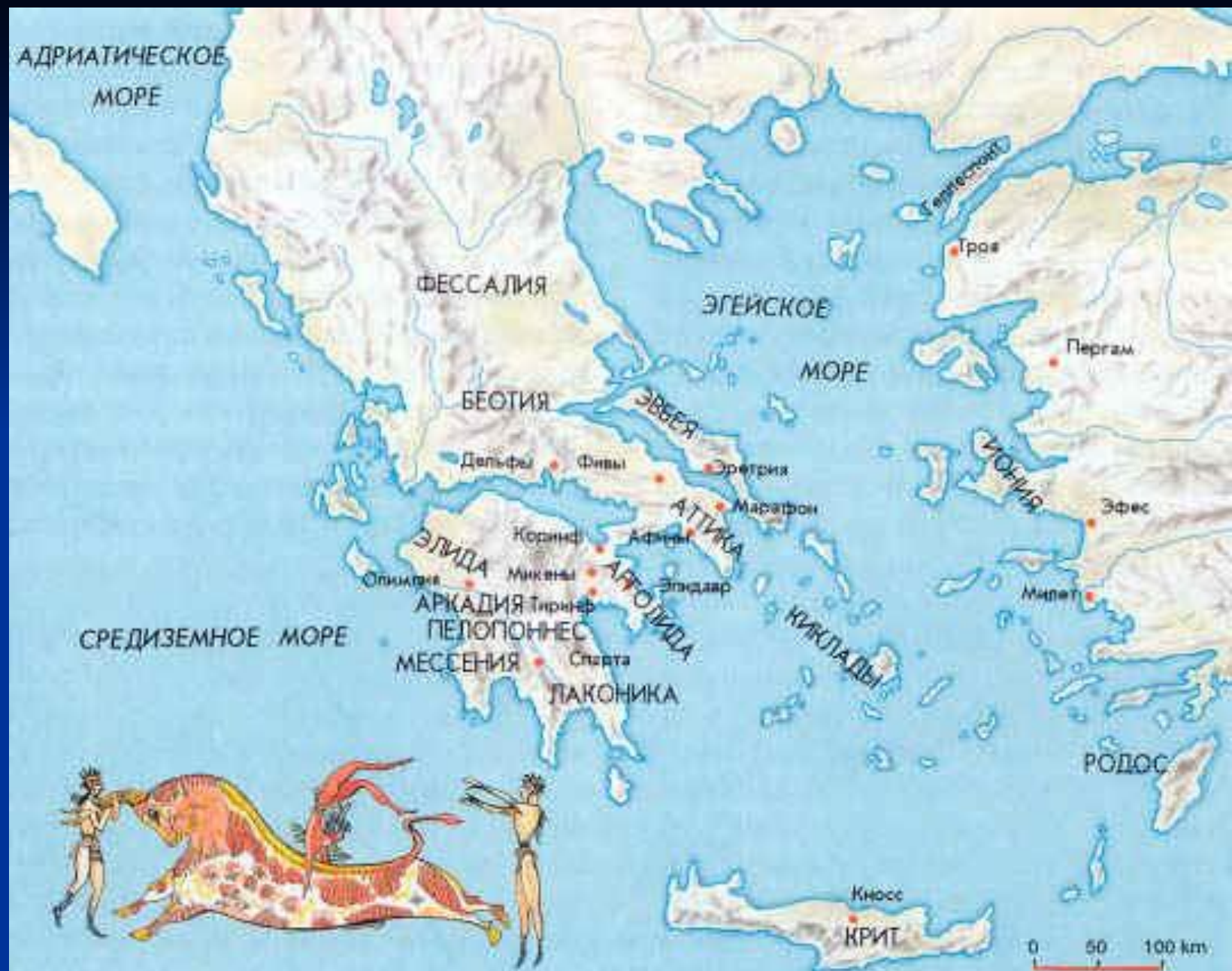
Греция VIII-VI вв.