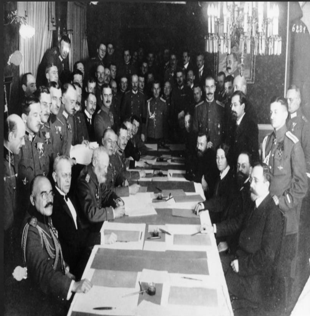
Переговоры Правительства с членами народных партий

Фактически в стране сложились 2 политические силы : военно-монархические и умеренно-либеральные. Первые выступали за сохранение монархии и продолжение войны, вторые за полное перемирие и демократические реформы. Все это привело в правительственной «чехарде», и в короткий срок сменилось сразу 3 канцлера. Однако в итоге правительство пошло на уступки народы, проведя нужные реформы, однако было слишком поздно и революция уже шла полным ходом.