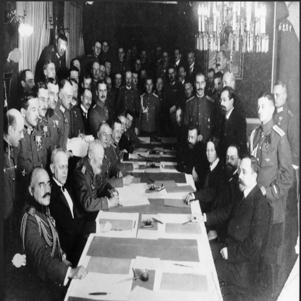
Переговоры Правительства с членами народных партий

Фактически в стране сложились 2 политические силы : военно-монархические и умеренно-либеральные. Первые выступали за сохранение монархии и продолжение войны, вторые за полное перемирие и демократические реформы. Все это привело в правительственной «чехарде», и в короткий срок сменилось сразу 3 канцлера. Однако в итоге правительство пошло на уступки народы, проведя нужные реформы, однако было слишком поздно и революция уже шла полным ходом.