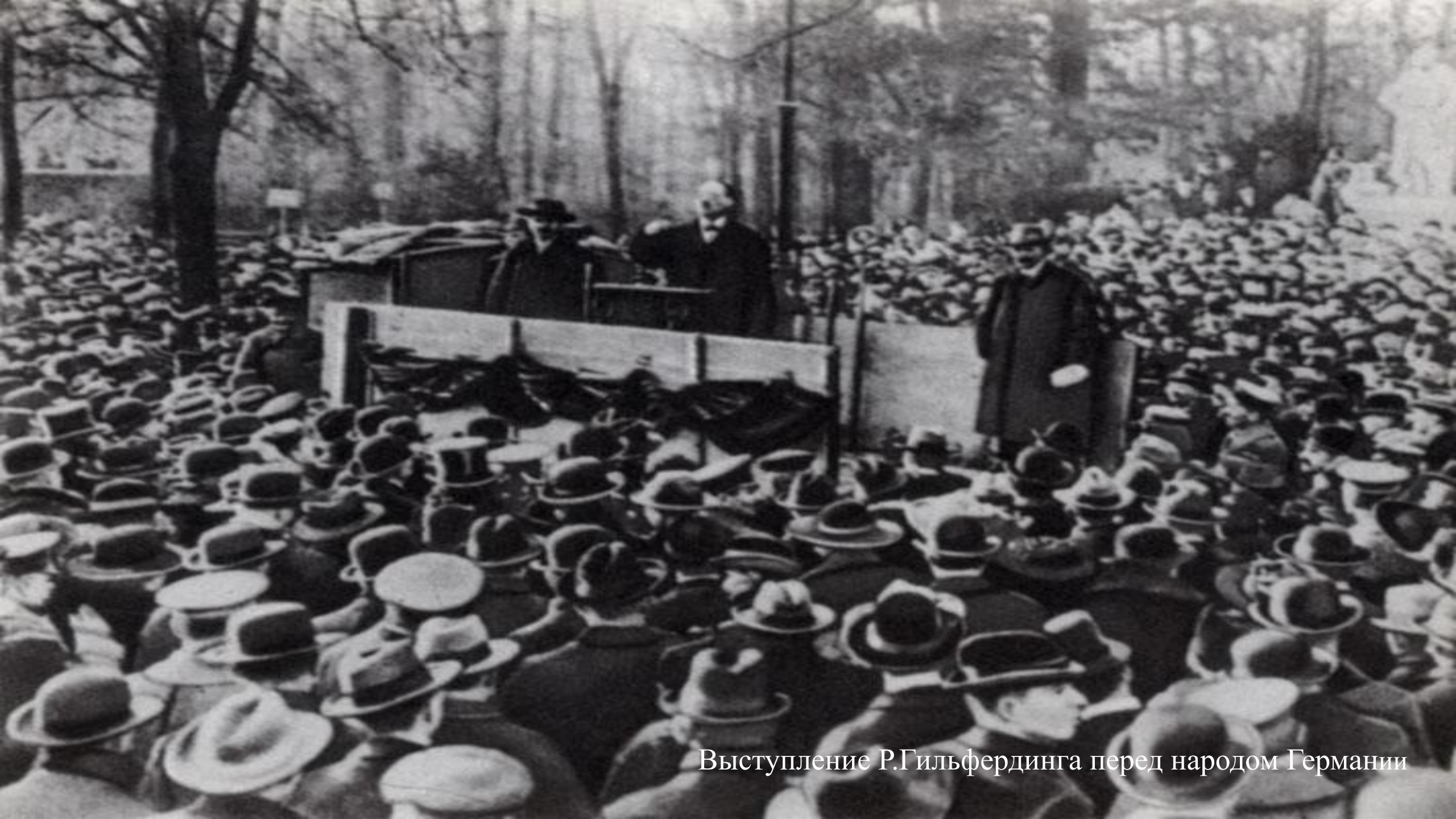
Выступление Р.Гильфердинга перед народом Германии