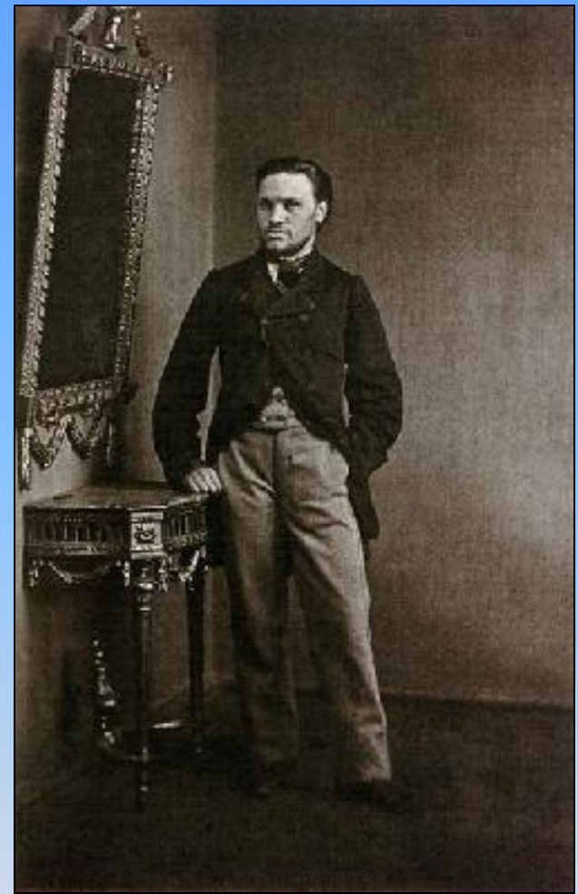
К.В.Калиновский Национальный герой Беларуси

Осенью 1861 года в Варшаве был организован повстанческий Городской комитет, позже переименованный в Центральный национальный комитет (ЦНК), куда вошли сначала «красные», а затем и «белые». Возглавил его Ярослав Домбровский. С целью подготовки восстания на территории бывшего ВКЛ летом 1862 года в Вильно был создан Литовский провинциальный комитет (ЛПК), который подчинялся ЦНК. Туда вошли сначала «красные», а потом и «белые». Левых в Беларуси возглавил Константин Винцент Калиновский (1838 – 1864). Он был из семьи бедного шляхтича Гродненской губернии, закончил Петербургский