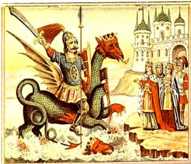
Славный Сильный и Храбрый Витязь Ерусланъ Лазаревичъ ѣдетъ на Чудо Великомъ Змѣи.

В сознании народа жило обостренное чувство