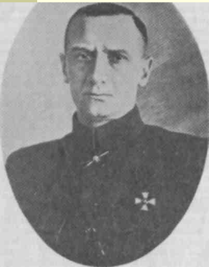
Колчак А. В.