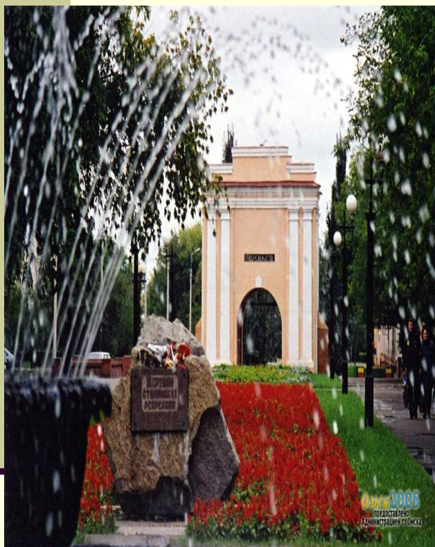
Тарские ворота Омской крепости