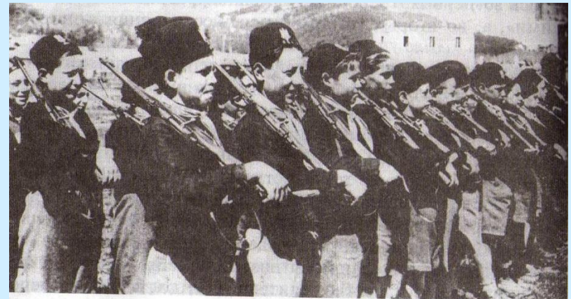
Члены детской фашистской организации. Италия