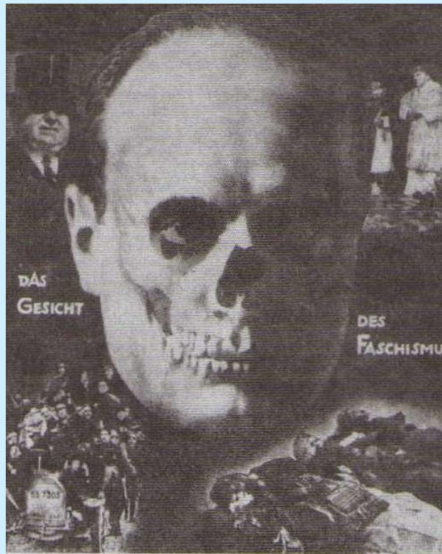
«Лицо фашизма». Плакат, изображающий Муссолини