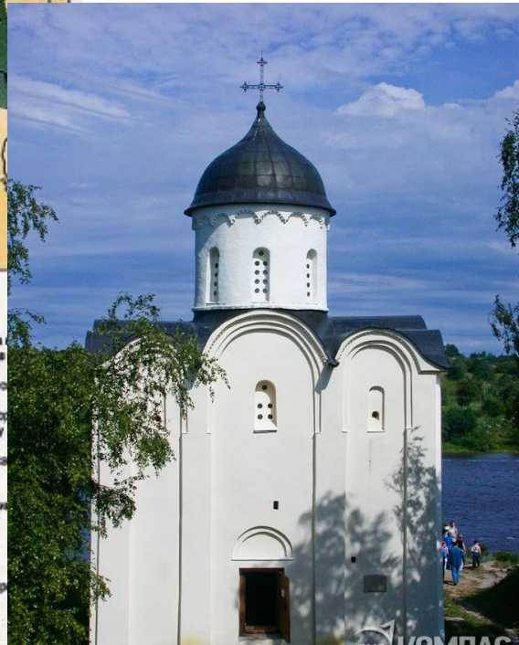
Церковь св. Георгия. Старая Ладога. XII в.