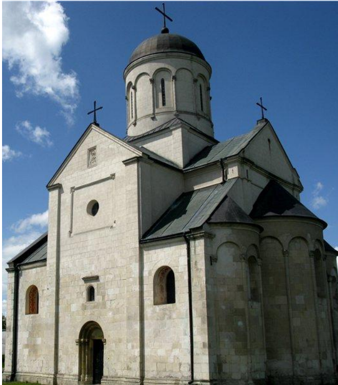
Церковь св. Пантелеймона. Галич, 1200 г.