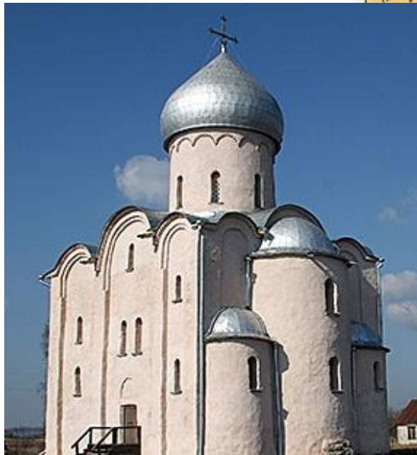
Церковь Спаса-на-Нередице близ Новгорода, XIII в.