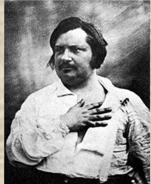
Дагеротип О. Бальзака

Фотографический процесс, способ непосредственного получения при съёмке позитивного изображения