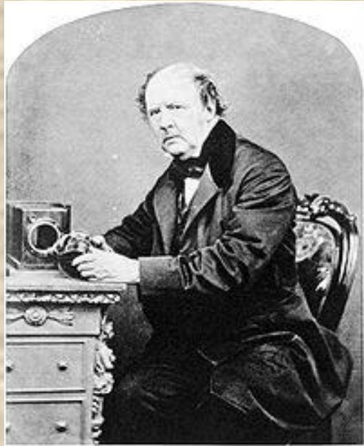
Вильям Генри Фокс Тальбот

В качестве носителя изображения Тальбот использовал бумагу, пропитанную хлористым серебром. Эта технология соединяла в себе высокое качество и возможность копирования снимков (позитивы печатались на аналогичной бумаге).