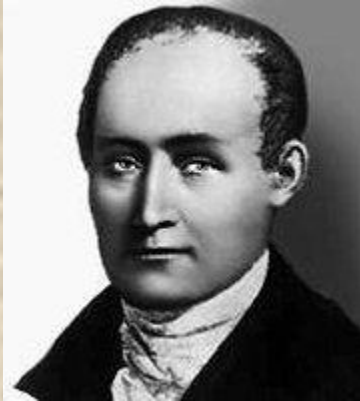
Жозеф Нисефор Ньепс

Ньепс начал свои опыты с хлоридом серебра. Поместив в камеру-обскуру бумагу, покрытую этим веществом, он получил негативные изображения, но не смог их закрепить.