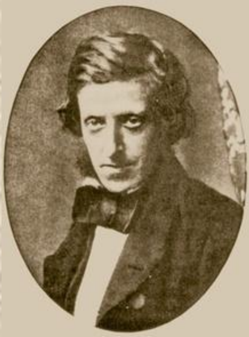
Фредерик Скотт Арчер

Дагерротипия и тальботипия были полностью заменены новым методом, получившим название мокрый коллодионный процесс, предложенный в 1851г англичанином Фредериком Скоттом Арчером. Применение этого процесса существенно повысило светочувствительность и позволило получить изображение исключительно высокого качества, особенно по резкости.