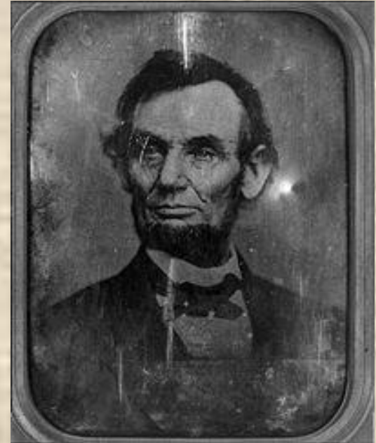
Пример дагерротипии: портрет Авраама Линкольна, 1864

Дагерр продолжил дело Ньепса, изобрел способ дагерротипии , который отличался очень высоким качеством изображения, но можно было получить только один снимок.