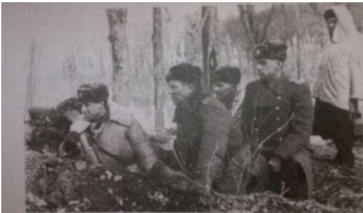
Группа офицеров 199-го Верхне-Удинского мотострелкового полка наблюдает за действиями китайцев

Отдельный реактивный дивизион «Град», которым я тогда командовал, располагался в городе Лесозаводске. 14 марта получили приказ совершить марш в район Даманского. 15 марта в 5.30 прибыли в район боевых действий. Расположили наблюдательные пункты на склонах горы Кафыла, непосредственно спускающейся к реке Уссури и к выходу на остров, установили боевые машины.