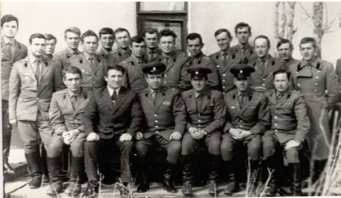
Офицеры дивизиона «Град», п. Приамурский ЕАО 1975 г.