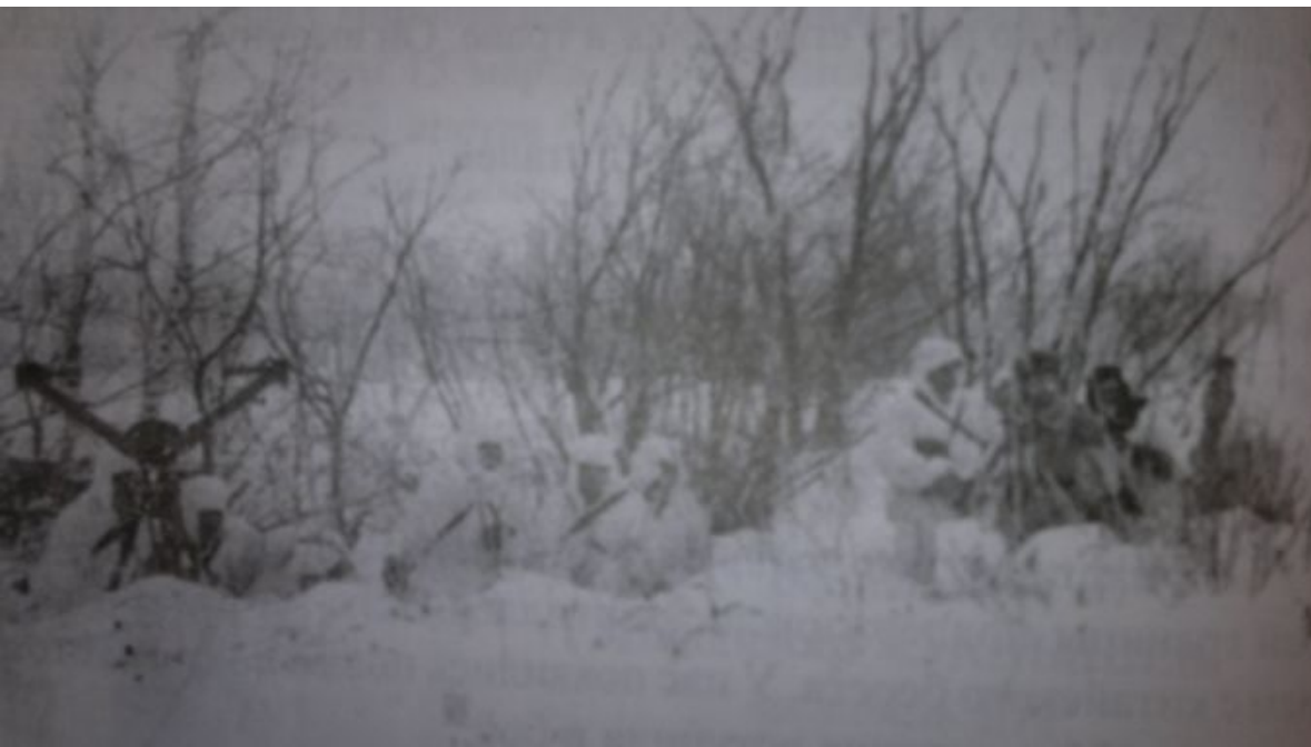
Разведчики дивизиона реактивных установок БМ-21 «Град» на наблюдательном пункте